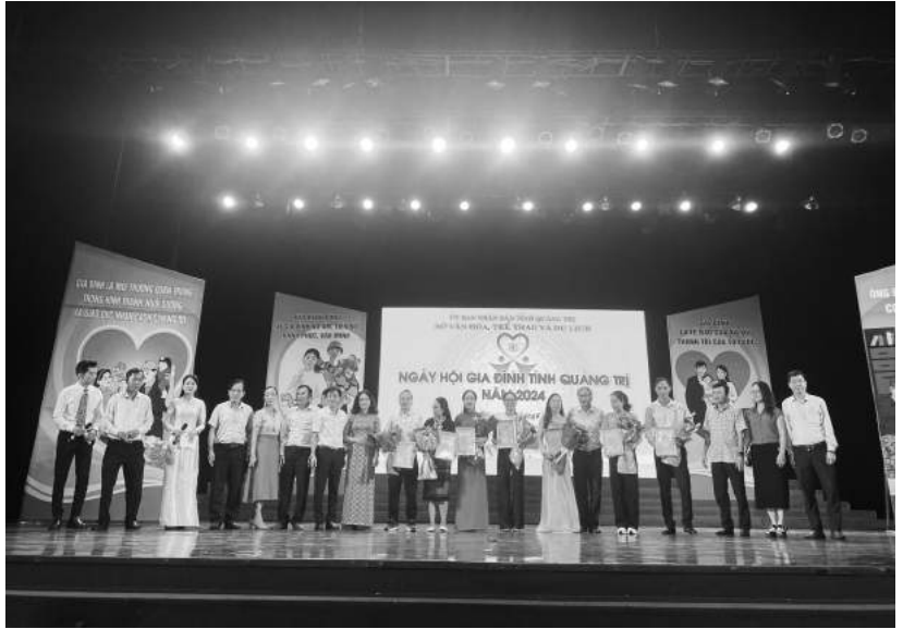
Lãnh đạo Sở Văn hóa trao danh hiệu gia đình văn hóa tại Ngày hội gia đình tỉnh Quảng Trị năm 2024

Gia đình chính là tổ ấm của mỗi người, là tế bào của xã hội, là môi trường lưu giữ, giáo dục, trao truyền các giá trị văn hóa dân tộc; gia đình có vai trò rất lớn trong việc hình thành và phát triển nhân cách con người. Xây dựng gia đình hạnh phúc chính là tạo nền tảng để xây dựng xã hội hạnh phúc, thịnh vượng. Sinh thời, Chủ tịch Hồ Chí Minh từng khẳng định: “Quan tâm đến gia đình là đúng, vì nhiều gia đình cộng lại mới thành xã hội, xã hội tốt thì gia đình càng tốt, gia đình tốt thì xã hội mới tốt” . Những năm qua thực hiện Chỉ thị số 49-CT/TW, ngày 21/02/2005 của Ban Bí thư Trung ương Đảng về xây dựng gia đình thời kỳ công nghiệp hóa, hiện đại hóa đất nước; Chỉ thị số 17-CT/TU, ngày 02/7/2013 của Ban Thường vụ Tỉnh ủy về tăng cường sự lãnh đạo của Đảng đối với công tác gia đình trong hình mới, Chương trình hành động số 14-CTHD/TU, ngày 30/9/2014 của Thành ủy Đông Hà về thực hiện Nghị quyết số 33-NQ/TW của BCH Trung ương Đảng (khóa XI) về “xây dựng và phát triển văn hóa, con người Việt Nam đáp ứng yêu cầu bền vững đất nước”. Công tác gia đình và phòng, chống bạo lực gia đình trên địa bàn thành phố đã đạt nhiều kết quả quan trọng, góp phần thực hiện thắng lợi nhiệm vụ chính trị, kinh