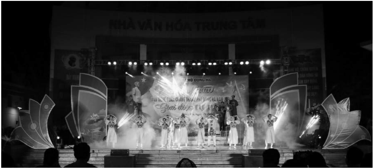
Hội diễn văn nghệ quần chúng thành phố Đông Hà năm 2024

cầu Đông Hà, phối hợp, hướng dẫn công tác tuyên truyền cổ động trực quan ở cơ sở đảm bảo chất lượng, hiệu quả. Thông qua công tác tuyên truyền cổ động trực quan nhằm tạo điểm nhấn mạnh mẽ cho diện mạo đô thị thành phố, toát lên được không khí tung bừng, rực rỡ cờ hoa trong ngày hội lớn, khơi dậy niềm tự hào trong cán bộ và Nhân dân về truyền thống anh hùng cách mạng và những thành tựu đạt được trong sự nghiệp xây dựng, đổi mới của quê hương, đất nước.