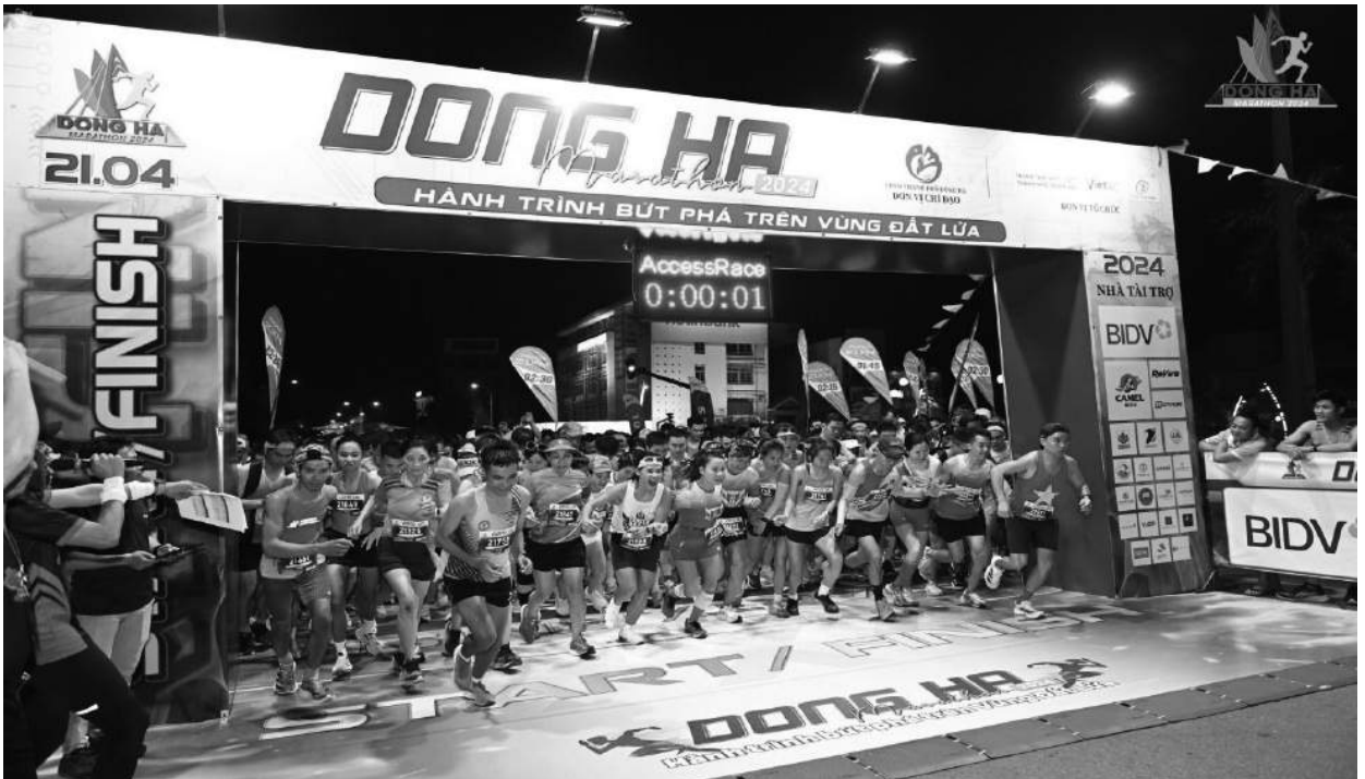
Giải chạy Marathon thành phố Đông Hà năm 2024

Trước nhiệm vụ chính trị trọng đại, được sự quan tâm lãnh đạo, chỉ đạo của Ban Thường vụ Thành uỷ, Thường trực HĐND & UBND thành phố, Trung tâm VH-TT-TD-TT thành phố nêu cao tinh thần trách nhiệm, khắc phục những khó khăn, nỗ lực cố gắng hoàn thành tốt nhiệm vụ được giao, góp phần cho các hoạt động chào mừng kỷ niệm 15 năm thành lập thành phố Đông Hà (11/8/2009 - 11/8/2024) và dự kiến công bố Quyết định của Thủ tướng Chính phủ công nhận thành phố Đông Hà là đô thị loại II được thành công tốt đẹp./.