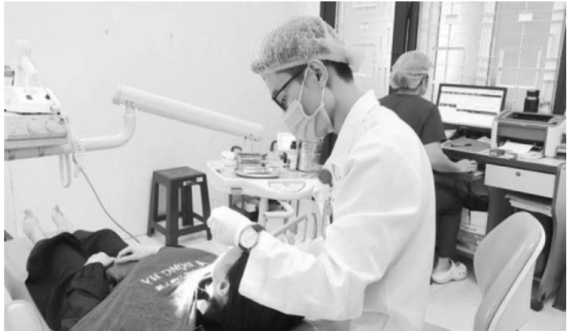
Bác sĩ chuyên khoa Tai-Mũi-Họng đang nội soi họng cho bệnh nhân

Về nhân lực hiện tại, khoa đã có đầy đủ các bác sĩ chuyên khoa: bác sĩ chuyên khoa Răng Hàm Mặt, Tai Mũi Họng, Mắt. Đội ngũ bác sĩ của khoa thường xuyên được tham gia các đợt tập huấn, tham dự các hội nghị, hội thảo để cập nhật các phác đồ điều trị mới nhất. Các bác sĩ cũng thường xuyên thực hiện các đề tài nghiên cứu khoa học mang tính mới, sáng tạo để tìm ra các giải pháp hiệu quả nhất, phù hợp nhất tại đơn vị nhằm nâng cao chất lượng khám chữa bệnh.