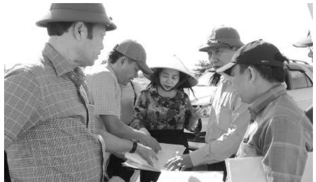
Lãnh đạo thành phố kiểm tra các công trình trên địa bàn thành phố Đông Hà tại thực địa

Tiếp tục thực hiện công tác rà soát lại các quy hoạch phân khu chức năng, quy hoạch chi tiết tỷ lệ 1/500 trên địa bàn không còn phù hợp với điều kiện thực tế, tính khả thi không cao. Hoàn thiện Đề án phân loại đô thị thành phố Đông Hà đạt đô thị loại 2, điều chỉnh Chương trình phát triển đô thị thành phố Đông Hà đến năm 2045 trình UBND tỉnh xem xét, trình HĐND tỉnh thông qua. Tiếp tục hoàn thiện đồ án điều chỉnh quy hoạch chung Phường 3 và Đông Lễ; phê duyệt điều chỉnh kế hoạch lựa chọn nhà thầu thực hiện đồ án điều chỉnh quy hoạch phân khu tỷ lệ 1/2000 các Phường: 1, 2, 4, 5. Tiếp tục thực hiện Đề án xã hội hóa xây