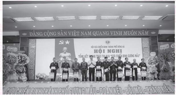
Đ/c: Hồ Sỹ Trung, Phó Bí thư Thành ủy, Chủ tịch UBND thành phố trao tặng quà cho Hội viên Hội CCB gương mẫu

Phát biểu tại Hội nghị, đồng chí Hồ Sỹ Trung - Phó Bí thư Thành ủy, Chủ tịch UBND thành phố thay mặt Ban Thường vụ Thành ủy chúc mừng và biểu dương những thành tích mà Hội Cựu Chiến binh thành phố đã đạt được trong thời gian qua; nhấn mạnh một số giải pháp trong thời gian tới nhằm tổ chức thực hiện tốt phong trào thi đua “ Cựu chiến binh gương mẫu ” trong giai đoạn 2024 - 2029; đồng thời bày tỏ sự tin tưởng rằng các cấp Hội Cựu Chiến binh thành phố sẽ phát huy truyền thống đó để