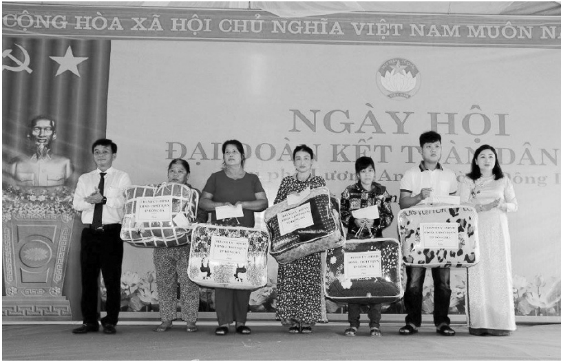
Lãnh đạo thành phố tặng quà nhân ngày Hội Đại đoàn kết toàn dân tộc

côi với số tiền 2.400.000 đồng. Nổi bật tại Ngày hội, các Ban công tác Mặt trận khu dân cư đã phát động các phong trào thi đua, tổ chức ký cam kết ra mắt xây dựng các mô hình tự quản trên các lĩnh vực thực hiện hài hòa giảm nghèo gắn với bảo vệ môi trường, xây dựng địa bàn 03 không: không ma túy, cờ bạc, tín dụng đen, mô hình “liên thế hệ”; khởi công xây dựng 03 tuyến đường bê tông, 01 tuyến điện chiếu sáng với tổng kinh phí xây dựng 345.512.000 đồng (Nhân dân đóng góp 97.612.000 đồng), khánh thành 01 công trình sân, nhà vệ sinh Nhà văn hóa khu phố Lương An - phường Đông Lễ tổng trị giá 150.000.000 đồng và tổ chức các trò chơi dân gian. Ngày hội Đại đoàn kết toàn dân tộc đã thực sự tạo không khí vui tươi, phấn khởi trong các tầng lớp nhân dân thành phố, có sức lan tỏa sâu rộng, đây không chỉ là ngày vui mà còn là dịp kết nối cộng