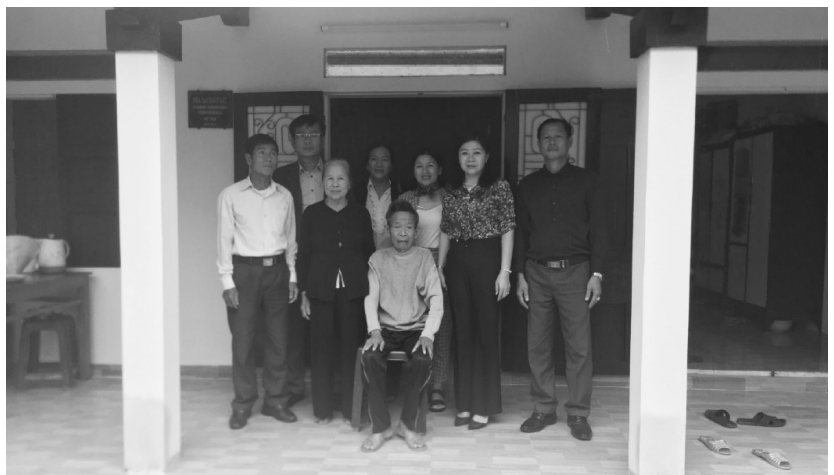
Lãnh đạo thành phố thăm và tặng quà nhân ngày Hội Đại đoàn kết toàn dân tộc

Đồng thời, Ban Thường trực Ủy ban MTTQ thành phố chỉ đạo Mặt trận các địa phương và các tổ chức thành viên đẩy mạnh công tác tuyên truyền, vận động đoàn viên, hội viên và Nhân dân tích cực tham gia thực hiện các cuộc vận động, phong trào thi đua, Đề án, công tác giảm nghèo, vận động ủng hộ Quỹ “Vì người nghèo” các cấp, ủng hộ kinh phí, huy động ngày công để hỗ trợ, giúp đỡ làm nhà, sửa nhà ở cho các hộ nghèo, góp phần cùng thành phố giảm tỷ lệ hộ nghèo bình quân hàng năm là 0,6%/năm mà Nghị quyết Đại hội Đảng bộ thành phố lần thứ XIII đã xác định./.