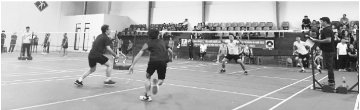
Giải Cầu lông công chức, viên chức, người lao động ngành GD&ĐT thành phố Đông Hà năm 2022

ki niệm sâu sắc về thầy cô và mái trường”; các đơn vị trường học cũng tổ chức nhiều hoạt động, mang tính giáo dục, lan tỏa rộng rãi như tổ chức Tọa đàm, thi nét chữ Người thầy, làm đồ dùng đồ chơi, văn nghệ, vẽ tranh Thay lời muốn nói, thăm tặng quà tri ân các thế hệ giáo viên đã nghỉ hưu... Ngoài ra các đơn vị trường học còn xây dựng nhiều công trình, phần việc chào mừng với tổng số tiền hơn 2 tỷ đồng.