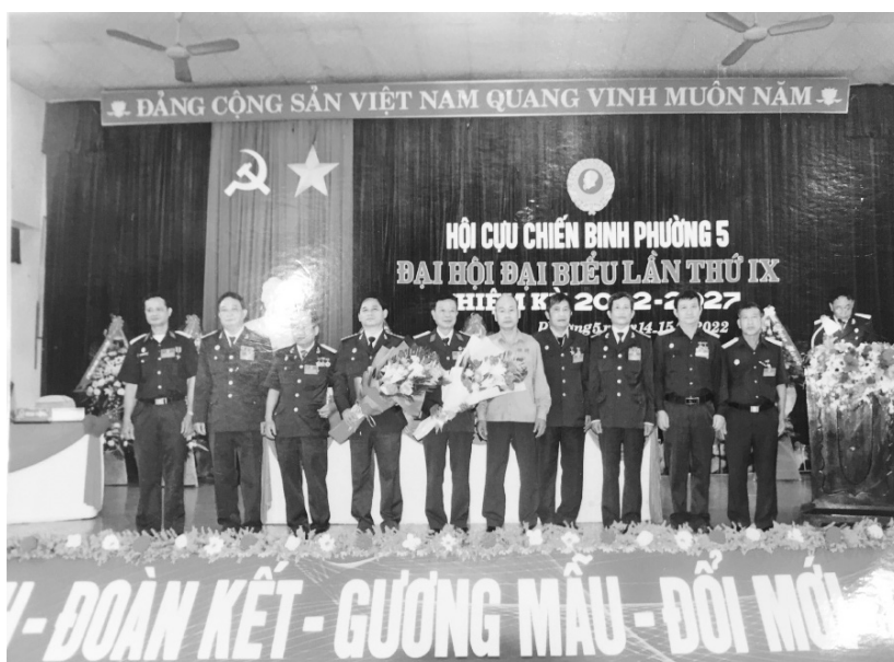
Ra mắt BCH Hội Cựu chiến binh Phường 5

Trong những năm 90 của thế kỷ 20 tình hình thế giới và khu vực có những diễn biến phức tạp. Các nước xã hội chủ nghĩa Đông Âu bị tan rã... trước yêu cầu nhiệm vụ mới của cách mạng phải bảo vệ Đảng, bảo vệ chế độ xã hội chủ nghĩa; nhiều CCB thiết tha có nguyện vọng đề nghị cho thành lập một tổ chức hợp pháp đặt dưới sự lãnh đạo của Đảng để tiếp tục góp phần cùng với toàn Đảng,