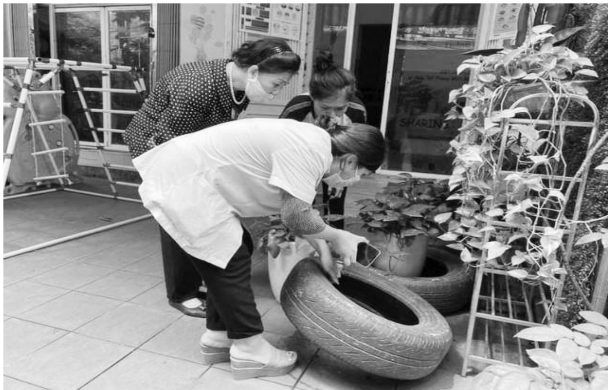
Người dân cần chủ động vệ sinh môi trường để phòng chống dịch sốt xuất huyết.

- Đeo khẩu trang, rửa tay bằng xà phòng và nước sạch hoặc dung dịch sát khuẩn tay (nhất là sau khi ho, hắt hơi). Không khạc nhổ bừa bãi nơi công cộng.