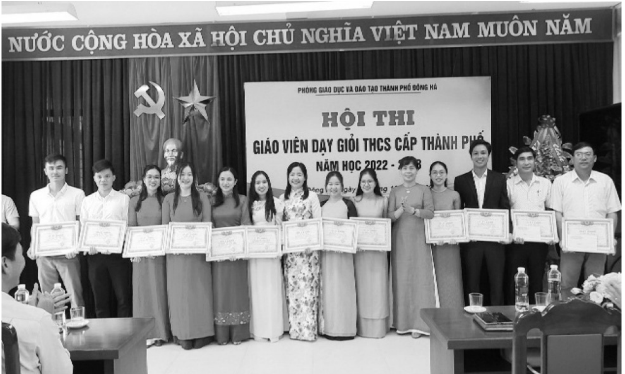
Hội thi Giáo viên dạy giỏi THCS cấp thành phố năm học 2022-2023