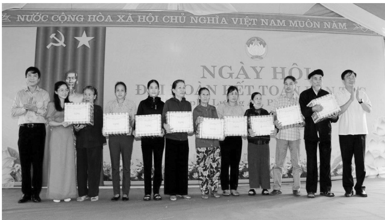
Lãnh đạo tỉnh tặng quà nhân ngày Hội Đại đoàn kết toàn dân tộc

trong toàn dân, tiếp tục củng cố và phát huy sức mạnh khối đại đoàn kết toàn dân tộc tham gia thực hiện nhiệm vụ chính trị cơ sở. Tại ngày hội đã biểu dương 291 hộ gia đình văn hóa tiêu biểu; 121 tổ chức, cơ quan, đơn vị, doanh nghiệp, cá nhân có nhiều đóng góp xã hội; trao 736 suất quà, tổng trị giá 316.000.000 đồng; hỗ trợ sinh kế cho 17 hộ nghèo với tổng số tiền 77.000.000 đồng; hỗ trợ sửa chữa và xây dựng 9 Nhà đại đoàn kết cho 9 hộ nghèo với tổng số tiền 370.000.000 đồng; trao đỡ đầu 01 trẻ mồ