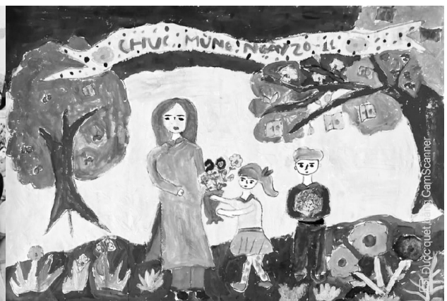
Một số hoạt động thi đua chào mừng kỷ niệm 40 năm Ngày nhà giáo Việt Nam 20/11/1982 – 20/11/2022