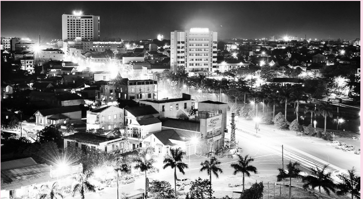
Một góc Đông Hà về đêm

Mười một tháng đầu năm, mặc dù thành phố còn gặp nhiều khó khăn, thách thức lớn; nhưng với sự quyết tâm cao nhất của cả hệ thống chính trị, Nhân dân toàn thành phố và cộng đồng doanh nghiệp, đã phát huy tinh thần đoàn kết, huy động mọi nguồn lực để chăm lo, ổn định đời sống cho người dân và nỗ lực duy trì hoạt động sản xuất, kinh doanh. Kết quả đạt được của các ngành, lĩnh vực trong tháng 11 và 11 tháng qua tiếp tục phát triển ổn định.