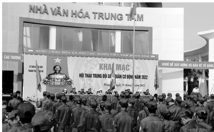
Toàn cảnh lễ khai mạc Hội thao Trung đội Dân quân cơ động năm 2022

liệt sỹ (27/7/1947- 27/7/2022). Xây dựng kế hoạch và tổ chức điều động 90 đồng chí lực lượng nữ DQTV luyện tập đội ngũ tham gia diễn binh trong Lễ thượng cờ “Thống nhất non sông” kỷ niệm 50 năm giải phóng tỉnh Quảng Trị bảo đảm tốt, được cấp trên đánh giá cao. Làm tốt công tác tuyển chọn và gọi công dân nhập ngũ, bàn giao cho các đơn vị 112 công dân theo chỉ tiêu được giao, tổ chức tốt Lễ Giao nhận quân, bảo đảm trang trọng, an toàn, đúng quy định. Làm tốt công tác chuẩn bị và tổ chức huấn