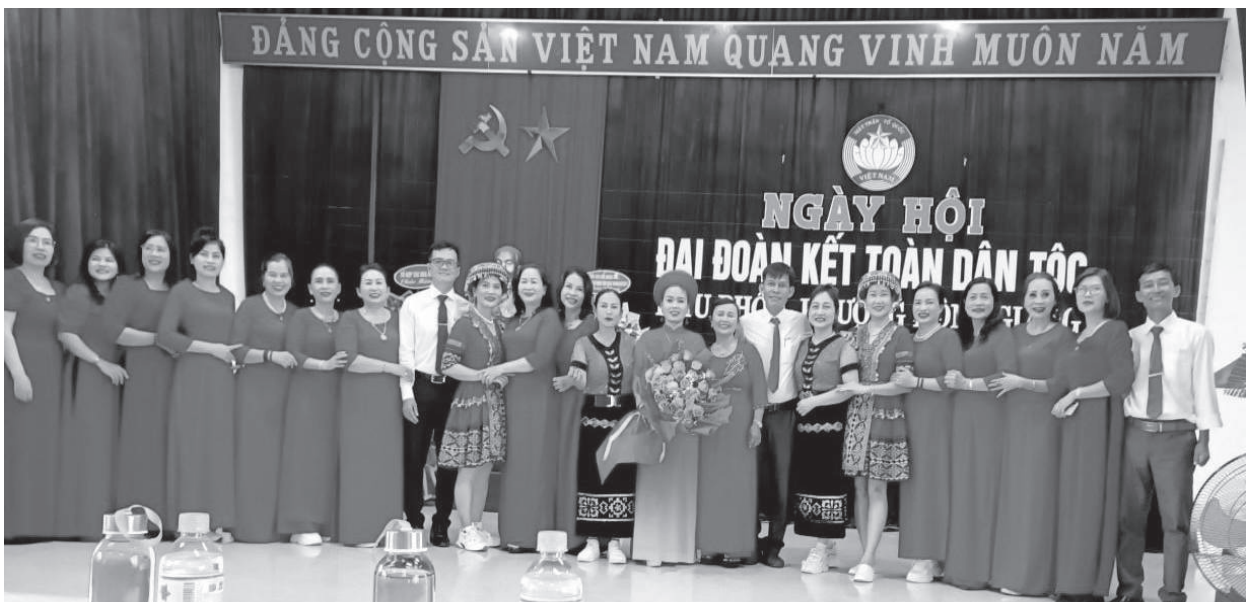
Ngày Hội Đại Đoàn Kết Toàn Dân Tộc của Khu phố 1, phường Đông Giang

Các khu phố duy trì thực hiện tốt quy ước văn hóa, chú trọng thực hiện nếp sống văn minh trong việc