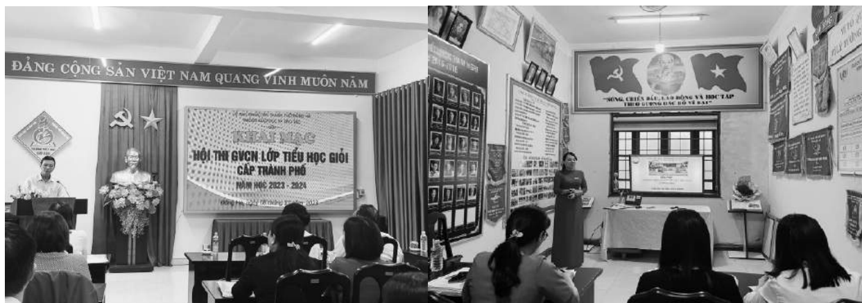
Hội thi Giáo viên chủ nhiệm lớp tiểu học giỏi cấp thành phố năm học 2023 - 2024

Tổ chức tuyên dương, khen thưởng cho các tập thể và cá nhân đạt thành tích trong Kỳ thi. Tham mưu UBND thành phố khen thưởng cho 22 học sinh đạt giải nhất. Phòng khen thưởng cho 03 tập thể đạt giải xuất sắc toàn đoàn, 12 đội đạt giải Nhất, 11 đội đạt giải Nhì, 07 đội đạt giải Ba, 11 đội đạt giải Khuyến khích; khen thưởng cho 54 học sinh đạt giải Nhì, 79 học sinh đạt giải Ba.