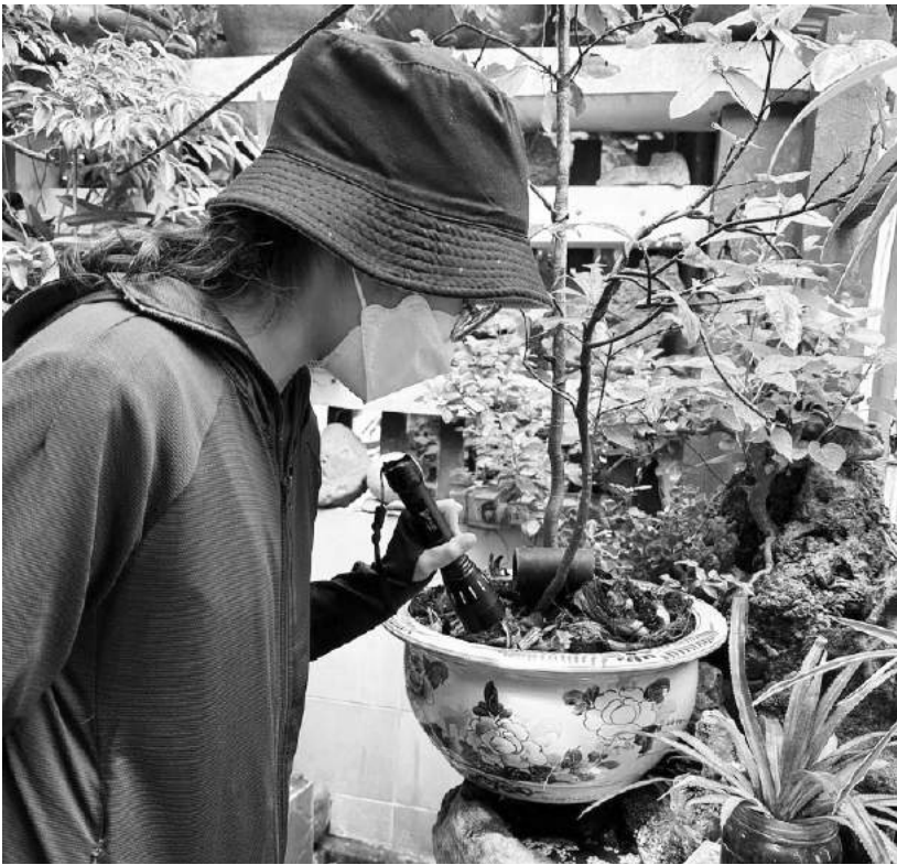
Cán bộ trung tâm y tế thành phố Đông Hà kiểm tra lăng quăng/bọ gậy

huyết và các biện pháp phòng, chống dịch bằng nhiều hình thức: truyền thông lưu động, treo pano, áp phích, tờ rơi. Huy động các ban, ngành, đoàn thể, cơ quan, doanh nghiệp tại địa phương tăng cường tuyên truyền để người dân biết và tham gia các đợt tổng vệ sinh môi trường; thông báo rộng rãi và công khai về phun hóa chất xử lý, để người dân nắm được lịch phun hóa chất trên địa bàn phường; tập trung tuyên truyền người dân dọn dẹp nhà cửa thoáng, sạch sẽ, loại bỏ các vật dụng chứa nước đọng; ngủ phải mắc màn.