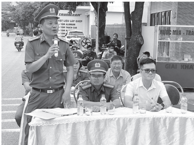
Phường Đông Giang thực tập phương án chữa cháy, cứu nạn cứu hộ

Công tác vận động giải phóng mặt bằng, xây dựng văn minh đô thị và vệ sinh môi trường, giữ gìn cảnh quan xanh - sạch - đẹp, xã hội hoá xây dựng đường bê tông, khơi thông hệ thống thoát nước... được quan tâm. Tỷ lệ người dân đăng ký thu gom rác thải sinh hoạt đạt 97%; vận động xã hội hoá 05 tuyến đường bê tông hoá giao thông trị giá 685.569.000 đồng (Nhân dân đóng góp 110.868.000 đồng); 02 sân bê tông nhà văn hoá khu phố với diện tích 650m 2 , tổng kinh phí 93.000.000 đồng (Nhân dân đóng góp 69.000.000 đồng); lắp đặt 141 giá treo cờ Tổ Quốc 14.500.000 đồng. Thực hiện 04 cuộc đối thoại vận động 14/16 trường hợp liên quan đến đường Trần