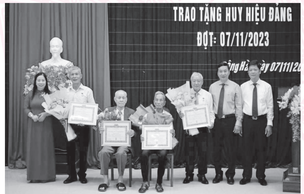
Thường trực Thành ủy trao tặng Huy hiệu Đảng cho các đảng viên đợt: 07/11/2023

6. Sáng ngày 07/11/2023, Ban Thường vụ Thành ủy tổ chức Lễ trao Huy hiệu Đảng đợt 07/11 cho các đảng viên trực thuộc Đảng bộ thành phố theo phân cấp nhân dịp Kỷ niệm 106 năm cách mạng tháng 10 Nga (07/11/1917 - 07/11/2023); đồng chí Lê Quang Chiến - UVBTV Tỉnh ủy, Bí thư Thành ủy chủ trì buổi lễ.