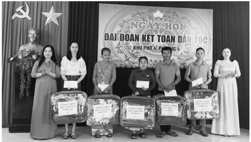
Lãnh đạo thành phố tặng quà nhân ngày Hội đại đoàn kết toàn dân tộc ở khu phố 4, phường 4, thành phố Đông Hà

lo cho người nghèo, cận nghèo khó khăn nhằm động viên, khích lệ vươn lên thoát nghèo bền vững. Đến nay, phường còn 55 hộ nghèo và 198 hộ cận nghèo, giảm 10 hộ nghèo so với đầu năm.