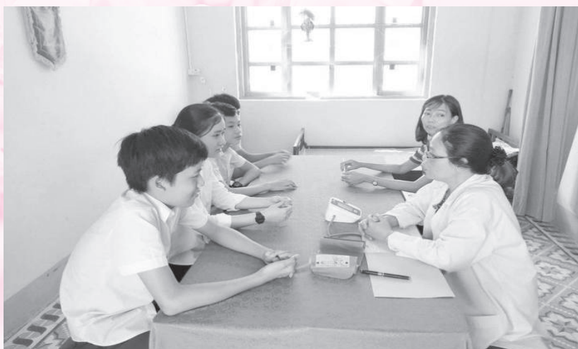
Kiểm tra Y tế học đường năm 2023

Đề công tác BHYT học sinh, sinh viên thực sự phát huy hiệu quả như mục tiêu đã đề ra, tin tưởng rằng, với sự nỗ lực, cố gắng, quyết tâm của cấp ủy, chính quyền, các ban ngành đoàn thể từ thành phố đến cơ sở cùng với sự phối hợp đồng bộ, vào cuộc quyết liệt của các cấp, các ngành liên quan, mục tiêu 100% học sinh, sinh viên trên địa bàn tham gia BHYT sẽ được hoàn thành. Từ đó, góp phần quan trọng vào việc đẩy nhanh lộ trình tiến tới BHYT toàn dân./.