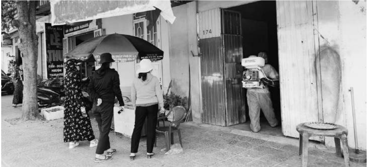
Cán bộ trung tâm y tế thành phố Đông Hà phun thuốc diệt muỗi

Từ đầu năm đến ngày 06/11/2023 đã có 147 trường hợp bị mắc sốt xuất huyết, tại 8/9 phường trên địa bàn thành phố Đông Hà. Những địa phương có số ca mắc sốt xuất huyết lớn nhất tại thành phố Đông Hà gồm: Phường 5 có 58 ca, Phường 1 có 29 ca, Phường 4 có 16 ca, Phường 3 có 13 ca, phường Đông Lương có 13 ca, phường Đông Lễ có 12 ca, phường Đông Giang có 4 ca, Phường 2 có 2 ca. Riêng đối với Phường Đông Thanh chưa ghi nhận ca mắc nào.