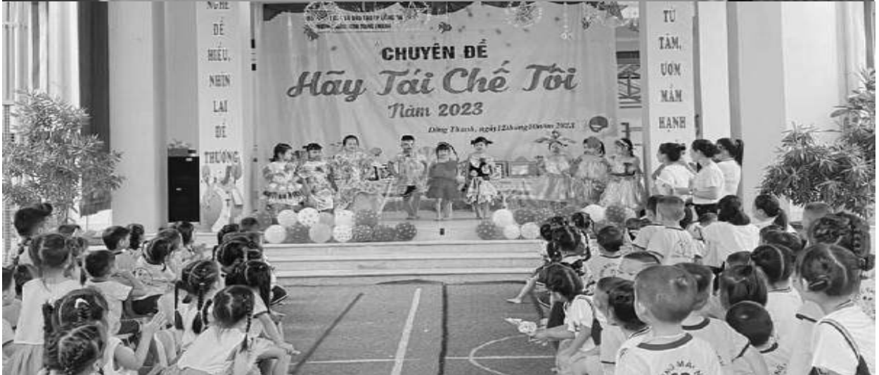
Một số hình ảnh về các hoạt động tại các đơn vị trường học