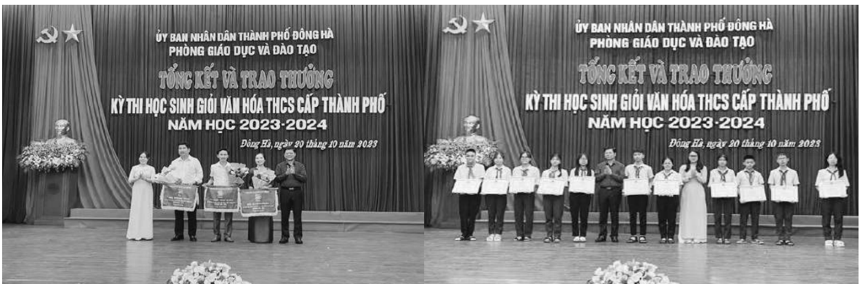
Tổng kết và trao thưởng Kỳ thi HSG văn hóa THCS cấp thành phố năm học 2023 - 2024

Phòng Giáo dục - Đào tạo chuẩn bị tốt các điều kiện và tổ chức thành công Kỳ thi học sinh giỏi văn hóa THCS cấp thành phố năm học 2023-2024.