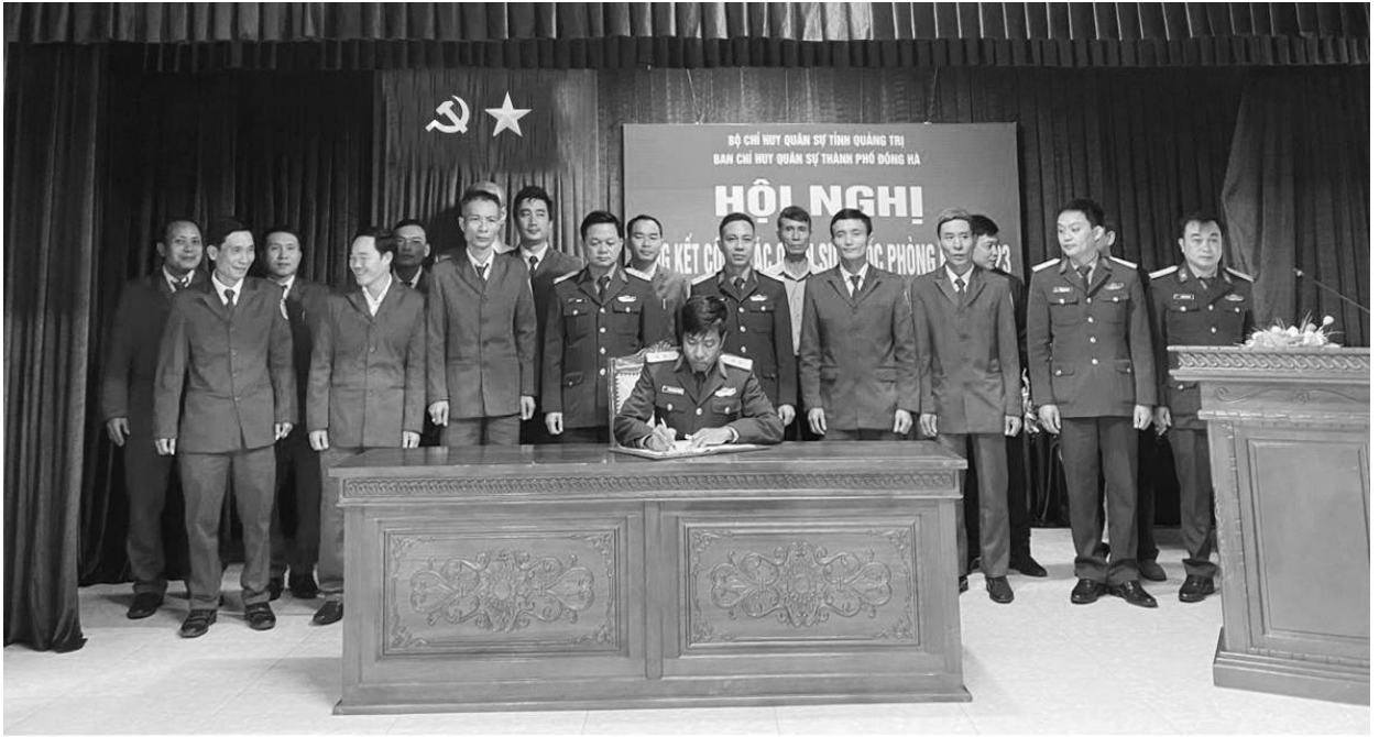
Ký cam kết thực hiện công tác quân sự quốc phòng năm 2024

niên nhập ngũ có hoàn cảnh khó khăn, động viên các cháu yên tâm lên đường thực hiện nghĩa vụ quân sự.