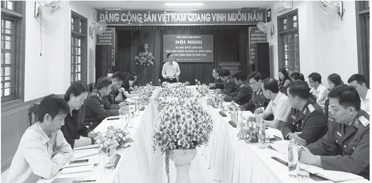
Hội nghị ra Nghị quyết lãnh đạo thực hiện nhiệm vụ quân sự quốc phòng và xây dựng Đảng bộ năm 2023 - 2024