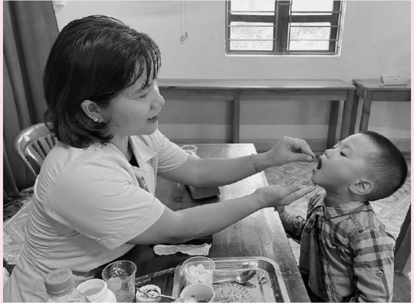
Cán bộ y tế cho trẻ uống vitamin A, cân trẻ tại Trạm y tế Phường 5

Để chuẩn bị tốt cho đợt chiến dịch, Trung tâm Y tế thành phố đã xây dựng kế hoạch triển khai tại 9 phường ở điểm uống tại Trạm Y tế và hội trường khu phố, chỉ đạo tất cả các Trạm y tế trên địa bàn tổ chức tuyên truyền về lợi ích và tầm quan trọng của việc uống Vitamin A kết hợp tẩy giun định kỳ cho trẻ đến các hộ gia đình. Vận động các bà mẹ đưa con đi cân đo trẻ, uống Vitammin A và uống thuốc tẩy giun; treo băng rôn ở trạm và các hội trường khu phố; lập danh sách