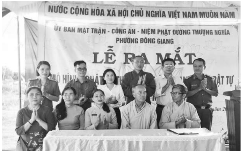
Công an và UBMTTQ Việt Nam thành phố Tổ chức xây dựng mô hình Phật tử tham gia giữ gìn an ninh trật tự và xây dựng văn minh đô thị tại phường Đông Giang TP Đông Hà

Công tác tuyên truyền, giáo dục pháp luật được chú trọng với nhiều hình thức phong phú, gắn liền với phong trào thi đua của các tổ chức chính trị - xã hội và lồng ghép triển khai trong các đợt sinh hoạt chính trị, xã hội ở khu dân cư, cơ quan, doanh