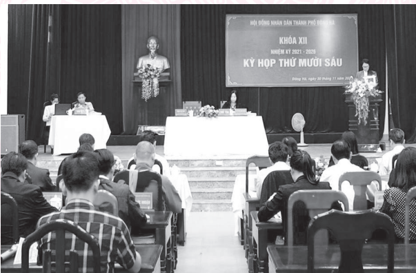
Kỳ họp HĐND thành phố kỳ họp thứ 16 - khóa XII

4. Sáng ngày 30/11/2023, HĐND thành phố Đông Hà khóa XII, nhiệm kỳ 2021 - 2026 đã tổ chức Kỳ họp thứ Mười sáu ( kỳ họp chuyên đề ). Kỳ họp đã xem xét, thảo luận, phê duyệt chủ trương đầu tư đối với 09 dự án; điều chỉnh chủ trương đầu tư đối với 16 dự án; điều chỉnh Kế hoạch đầu tư công trung hạn giai đoạn 2021-2025; nghe báo cáo về phương án vay và trả nợ vốn vay: Dự án Phát triển đô thị ven biển miền Trung hướng đến tăng trưởng xanh và ứng phó với biến đổi khí hậu thành phố Đông Hà, vay vốn của cơ quan Phát triển Pháp (AFD); xem xét báo cáo kết quả giám sát chuyên đề của HĐND thành phố về Kế hoạch đầu tư công trung hạn giai đoạn 2021 - 2025; thực hiện quy trình bãi nhiệm đại biểu HĐND thành phố khóa XII, nhiệm kỳ 2021 - 2025.