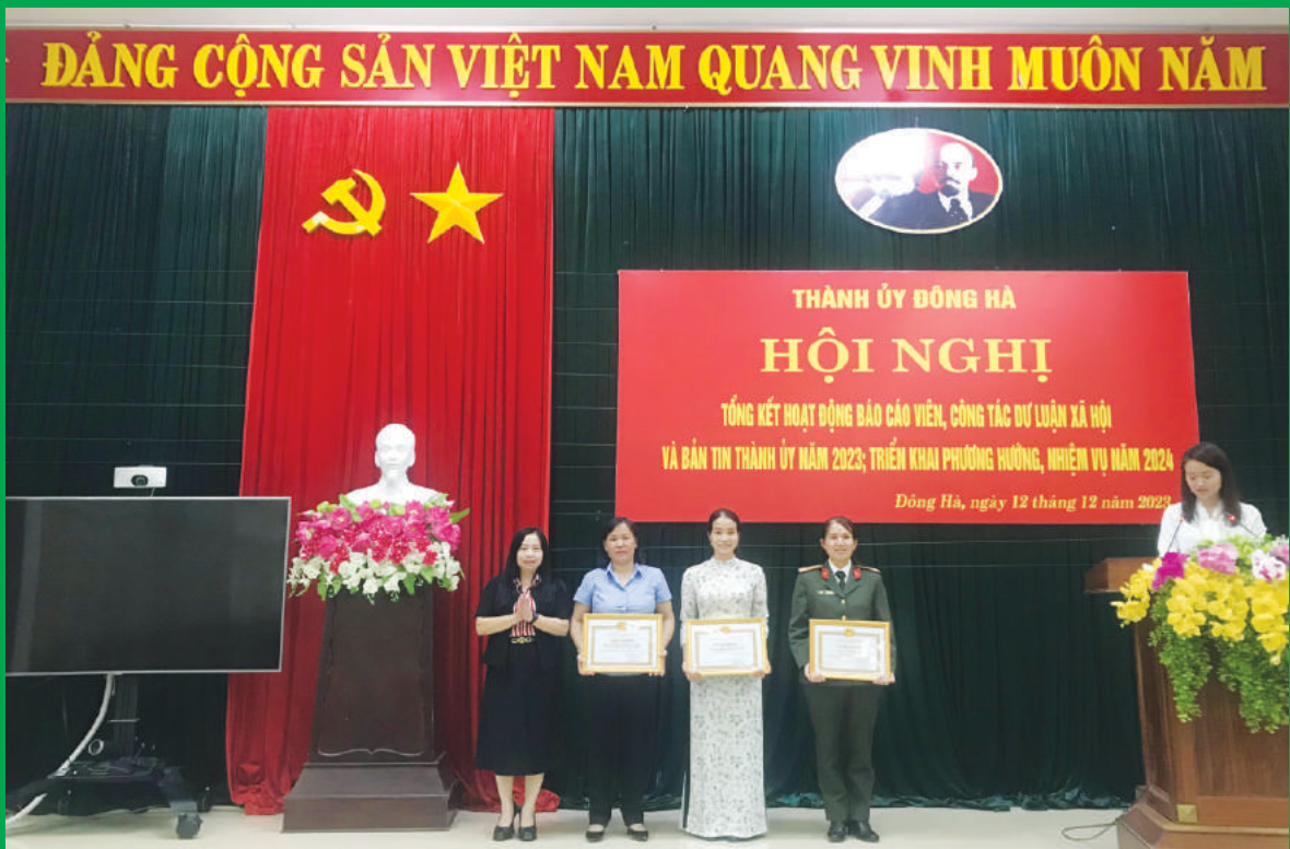
Đồng chí Lê Thị Anh Đào - Phó Bí thư Thường trực Thành ủy, Chủ tịch HĐND thành phố trao giấy khen cho các đồng chí có thành tích xuất sắc trong hoạt động Bản tin Thành ủy năm 2023