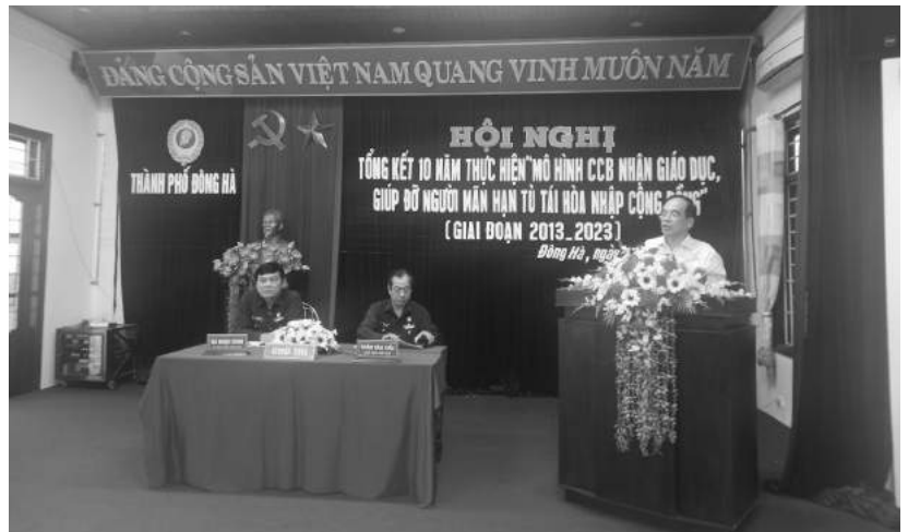
Hội nghị tổng kết 10 năm thực hiện “mô hình CCB nhận giáo dục, giúp đỡ người mãn hạn tù tái hòa nhập cộng đồng”

Căn cứ Nghị định số 80/NĐ-CP ngày 16/9/2011 của Chính phủ về quy định các biện pháp bảo đảm tái hòa nhập cộng đồng đối với người chấp hành xong án phạt tù, Hội CCB thành phố tổ chức quán triệt, triển khai thực