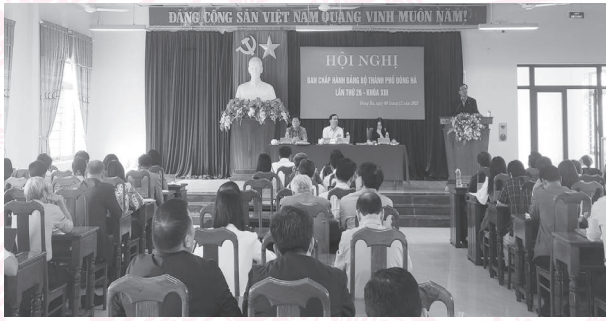
Hội nghị BCH Đảng bộ thành phố Đông Hà lần thứ 26 - Khóa XIII

rộng) để bàn và quyết định về nhiệm vụ phát triển kinh tế - xã hội, quốc phòng, an ninh năm 2024, đồng thời cho ý kiến về dự thảo Quy hoạch sử dụng đất đến năm 2030 thành phố Đông Hà.