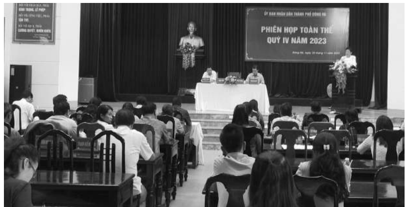
Phiên họp toàn thể quý IV năm 2023 của UBND thành phố

Xác định phát triển thương mại - dịch vụ, sản xuất công nghiệp - tiểu thủ công nghiệp là một trong những nhiệm vụ trọng tâm, thành phố đã chỉ đạo thực hiện đồng bộ các giải pháp