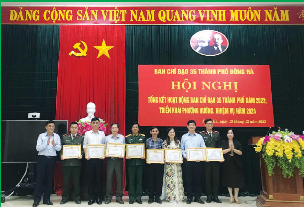
Đồng chí Lê Thị Anh Đào - Phó Bí thư Thường trực Thành ủy, Chủ tịch HĐND thành phố trao giấy khen cho các đồng chí có thành tích trong hoạt động Ban Chỉ đạo 35 thành phố năm 2023