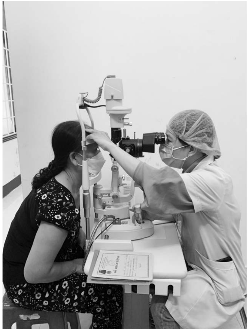
Khám chữa bệnh tại Trung tâm Y tế thành phố Đông Hà

5. Người bệnh hoặc người nghi bị đau mắt đỏ cần hạn chế tiếp xúc với người khác và đến cơ sở y tế để được khám, tư vấn, điều trị kịp thời. Không tự ý điều trị khi chưa có hướng dẫn của cán bộ y tế./.