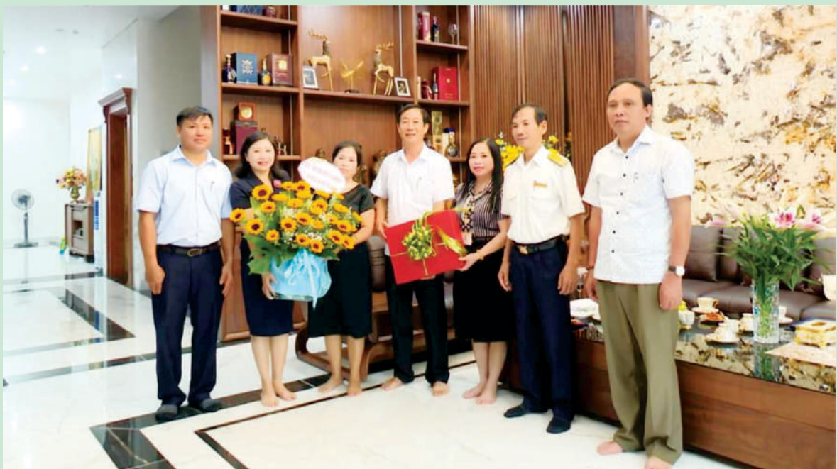
Đại diện lãnh đạo thành phố đến thăm, chúc mừng các doanh nghiệp tiêu biểu trên địa bàn thành phố