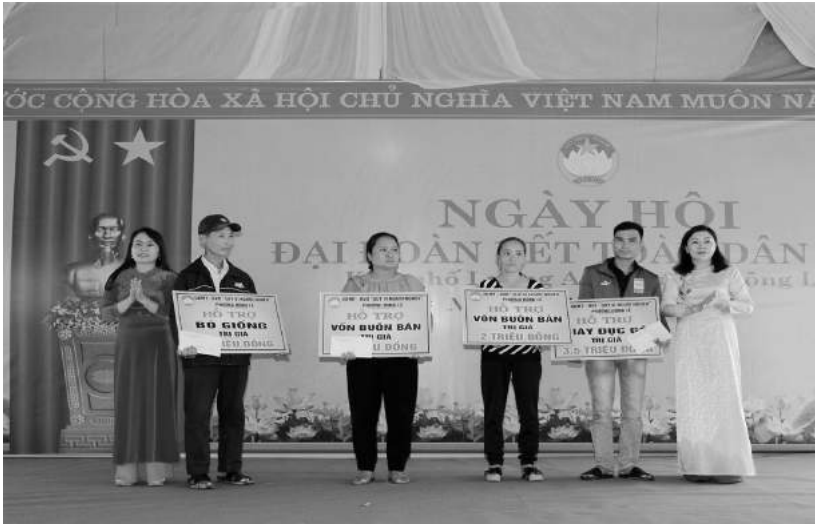
Lãnh đạo thành phố, phường trao hỗ trợ sinh kế cho hộ gia đình có hoàn cảnh khó khăn trên địa bàn phường Đông Lễ

lớn trong cộng đồng dân cư. Các hiện tượng mê tín, dị đoan, hủ tục lạc hậu từng bước được xóa bỏ, đẩy lùi. Thực hiện Chỉ thị số 16 -CT/TU ngày 15/8/2013 của Ban Thường vụ Thành ủy “ về việc thực hiện nếp sống văn minh trong việc cưới trên địa bàn thành phố Đông Hà ”; Đề án số 01/ĐA-UBMT của UBMT thành phố Đông Hà “ về văn minh trong tổ chức việc tang ”, Mặt trận, các tổ chức chính trị - xã hội đã tập trung phối hợp với chính quyền tuyên truyền, vận động các tầng lớp nhân dân từng bước thực hiện theo việc cưới, việc tang, lễ hội văn minh theo quy định. Trong thời gian trở lại đây, trên địa bàn phường không còn xuất hiện việc tang đề dài ngày; việc cưới không quá linh đình, lãng phí, quan hệ ứng xử láng giềng cởi mở, thân thiện hơn, truyền thống đoàn kết, tình làng, nghĩa xóm được phát huy. Đến nay, toàn phường có 8/8 khu phố