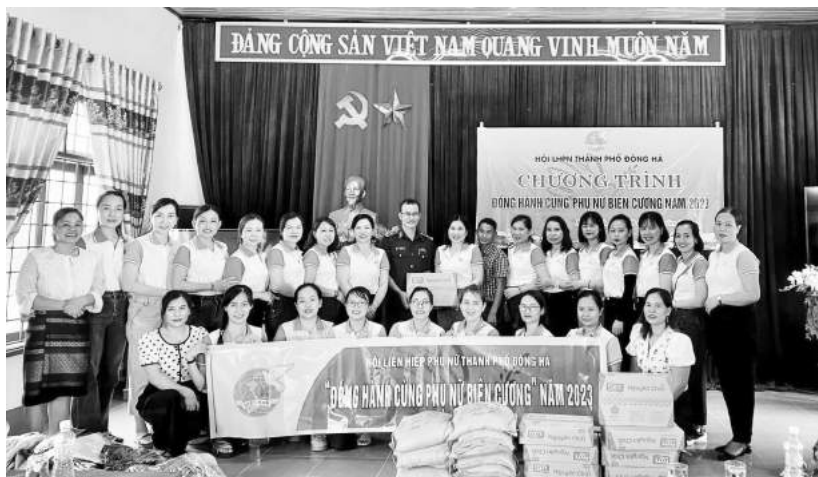
Hội LHPN thành phố Đông Hà tặng quà cho chương trình đồng hành cùng phụ nữ biên cương năm 2023

Có thể nói, các cấp Hội phụ nữ thành phố đã tích cực huy động được nhiều nguồn lực từ các tổ chức, cá nhân, cán bộ hội viên phụ nữ trên địa bàn để hỗ trợ cho hội viên, phụ nữ và người dân các xã biên giới như thăm hỏi, động viên và tặng quà; thúc đẩy sự nỗ lực, cố gắng của bà con sau khi được hưởng lợi trực tiếp từ chương trình. Một số đơn vị đã tích cực, chủ động tổ chức các chuyến đồng hành cùng phụ nữ biên cương tại các xã vùng biên của 02 huyện Hướng Hóa và Đakrông như Phường 1, phường Đông Lễ, phường Đông Lương, Phường 5, phường Đông Thanh... Qua thực hiện Chương trình, từ năm 2018 đến năm 2022, ước tổng số tiền ủng hộ tin nhắn, huy động và thăm tặng quà cho các xã ở huyện Hướng Hóa, Đakrông hơn 793 triệu đồng. Cùng với đó, tổ chức chương trình Đồng hành cùng phụ nữ biên cương năm 2023, Hội đã trao tặng hơn 500 suất