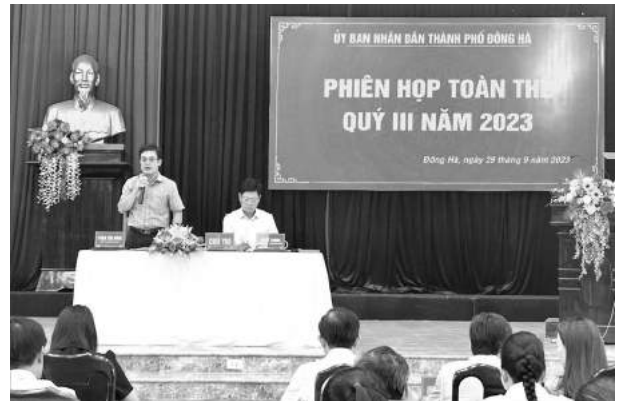
Phiên họp toàn thể quý III năm 2023 của UBND thành phố Đông Hà

2023 thực hiện 240.548 triệu đồng, đạt 45,99% dự toán HĐND tỉnh giao, đạt 33,36% dự toán HĐND thành phố giao. Tổng chi cân đối ngân sách 09 tháng đầu năm 2023 thực hiện: 334.383 triệu đồng đạt 47,72% dự toán HĐND thành phố giao; đảm bảo các nhu cầu phát triển kinh tế - xã hội, quốc phòng, an ninh, quản lý Nhà nước cũng như chi trả kịp thời cho các đối tượng theo quy định.