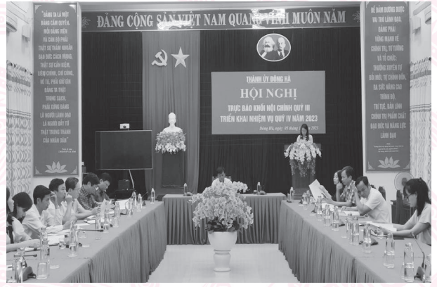
Hội nghị trực báo khối Nội chính thành phố quý III năm 2023