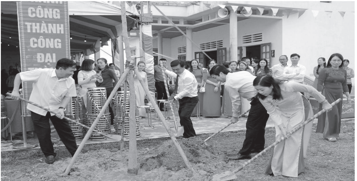
Lãnh đạo tỉnh, thành phố trồng cây lưu niệm tại Ngày hội phường Đông Lễ

Ngày 01/8/2003, Đoàn Chủ tịch Ủy ban Trung ương Mặt trận Tổ quốc Việt Nam đã ra Nghị quyết số 04/NQ/ĐCT-MTTW về việc tổ chức “Ngày hội Đại đoàn kết toàn dân tộc” và quyết định lấy ngày 18/11 hàng năm làm ngày tổ chức “Ngày hội Đại đoàn kết ở khu dân cư” nhằm tiếp tục xây dựng, củng cố và phát huy sức mạnh của khối đại đoàn kết toàn dân tộc, nâng cao vai trò, vị trí của Mặt trận Tổ quốc Việt Nam trong thời kỳ mới. Qua 20 năm tổ chức, Ngày hội trở thành một hoạt động mang ý nghĩa thiết thực ở khu dân cư và thực sự đã trở thành Ngày hội của toàn dân.