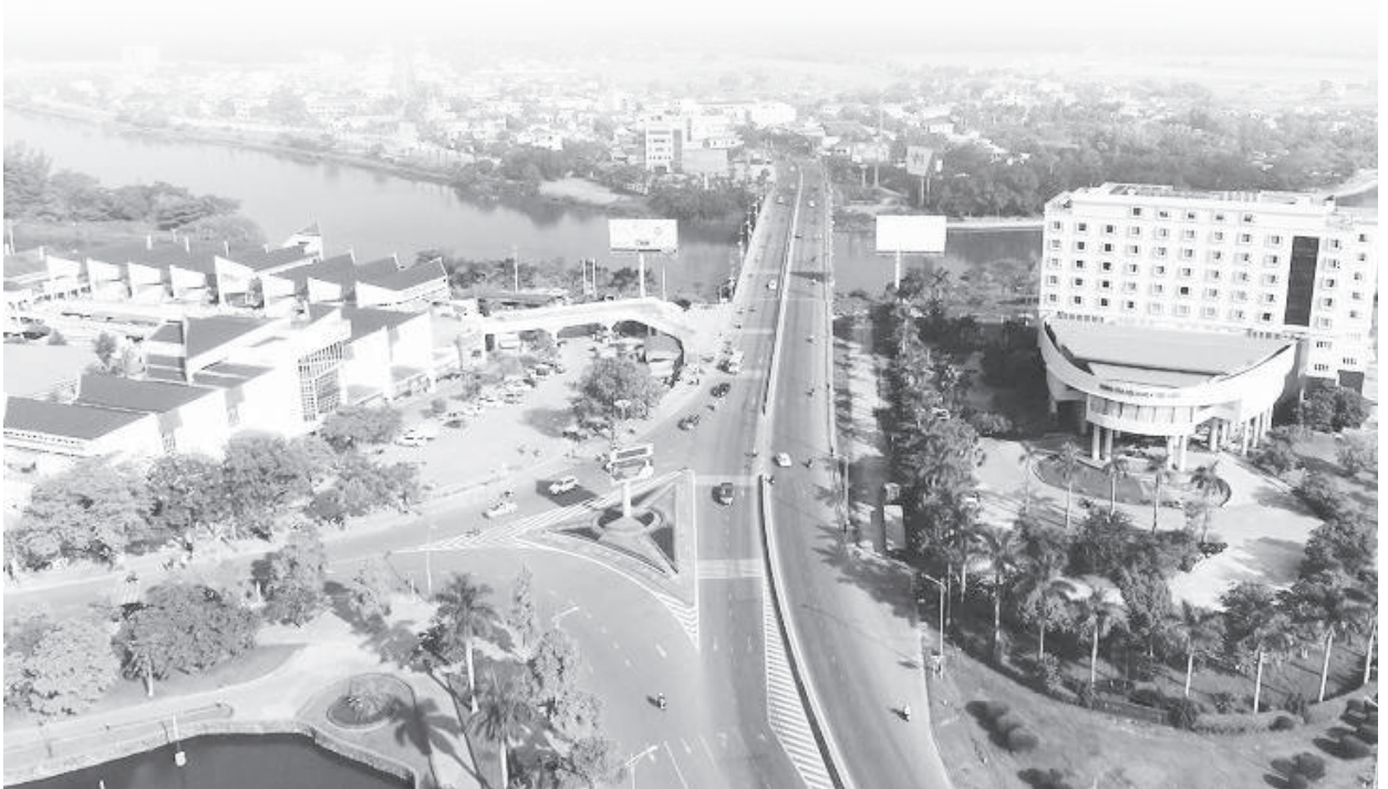
Một góc thành phố Đông Hà

xã hội năm 2023; các nội dung theo Chương trình công tác, kế hoạch hành động của UBND thành phố để đưa ra giải pháp tích cực, quyết liệt nhằm thực hiện hoàn thành các chỉ tiêu đề ra theo Kết luận số 18-KL/TU ngày 16/12/2022 của BCH Đảng bộ thành phố khóa XIII và Nghị quyết số 171/NQ-HĐND ngày 21/12/2022 của HĐND thành phố. Trong đó, tăng cường công tác quản lý hoạt động thương mại trên địa bàn; tập trung triển khai các chính sách hỗ trợ của Trung ương, của tỉnh đến các doanh nghiệp nhằm tháo gỡ khó khăn, khôi phục, phát triển sản xuất, kinh doanh. Cùng với đó, đẩy nhanh tiến độ lập các đề án điều chỉnh quy hoạch phân khu các phường, lập quy hoạch chi tiết một số khu vực phục vụ nhu cầu kêu gọi đầu tư trên địa bàn thành phố. Tập trung đào tạo nguồn nhân lực đáp ứng yêu cầu phát triển trong tình hình mới. Tăng cường phân cấp, phân quyền mạnh mẽ. Đẩy mạnh cải cách thủ tục hành chính, giảm thời gian, chi phí tuân thủ, giảm phiền hà cho người dân, doanh nghiệp.