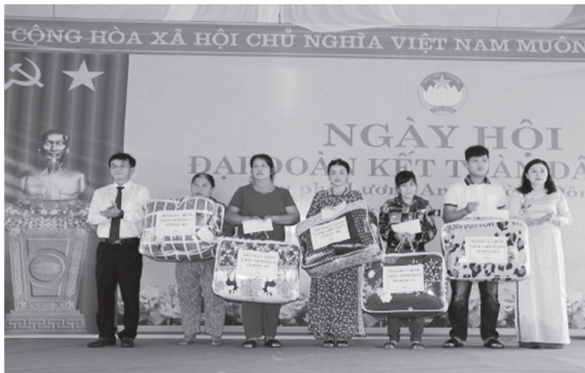
Lãnh đạo tỉnh tặng quà cho hộ gia đình có hoàn cảnh khó khăn trên địa bàn phường Đông Lễ

Qua 20 năm tổ chức Ngày hội đã có hơn 15.000 lượt hộ gia đình tham gia, tạo ra phong trào toàn dân đoàn kết giúp nhau phát triển kinh tế, xóa đói giảm nghèo, đảm bảo an sinh xã hội, xây dựng văn hóa, văn minh đô thị. Từ một phường với xuất phát điểm gặp rất nhiều khó khăn, năm 2003 tỷ lệ hộ nghèo chiếm gần 30% dân số, thông qua Ngày hội đã khơi dậy mạnh mẽ tinh thần đoàn kết phát huy ý chí tự lực, tự cường, tiềm năng và sức mạnh nội lực của mỗi người dân, mỗi gia đình đầu tư vốn, trí tuệ, công sức để phát triển sản xuất, mạnh dạn chuyển đổi cơ cấu kinh tế, mở rộng ngành nghề, đẩy mạnh dịch vụ. Hiện nay, tỷ lệ hộ nghèo trên địa bàn phường cuối năm 2022 chỉ còn 60 hộ chiếm tỷ lệ 2,26%; hộ cận nghèo 140 hộ chiếm tỷ lệ 5,7%. Nhiều mô hình làm ăn giỏi, làm giàu chính đáng xuất hiện ngày càng nhiều; tiêu biểu như các mô hình kinh tế trang trại, vùng nuôi tôm sú, mô hình kinh doanh, sửa chữa điện nước, mộc dân dụng và rất nhiều mô hình khác đã và đang tạo việc làm thường xuyên cho trên 100 lao động với thu nhập bình quân trên 05 triệu đồng/tháng. Thu nhập bình quân đầu người trên địa bàn phường đã thay đổi vượt bậc từ xấp xỉ 12 triệu đồng/người/năm 2003, đến nay tăng lên trên 50 triệu đồng/năm. Thông qua Ngày hội đã động viên Nhân dân tự giúp đỡ, hỗ trợ nhau về giống