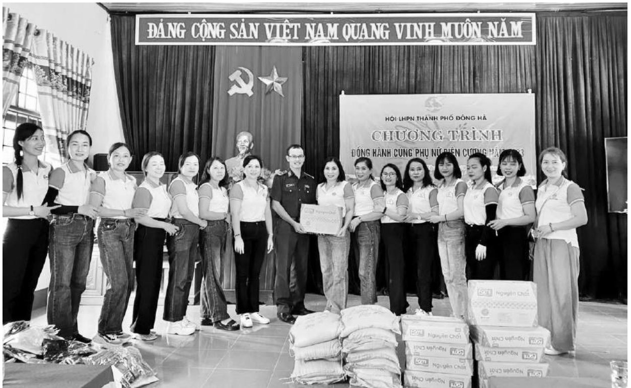
Hội LHPN thành phố Đông Hà tặng quà cho chương trình đồng hành cùng phụ nữ biên cương năm 2023

Chương trình “Đồng hành cùng phụ nữ biên cương” được thực hiện theo kế hoạch phối hợp giữa Hội LHPN Việt Nam và Bộ Tư Lệnh Bộ đội Biên phòng. Tại Đông Hà, chương trình “Đồng hành cùng phụ nữ biên cương” đã được các cấp Hội LHPN thành phố thực hiện từ năm 2018 đến nay và đạt được những kết quả tích cực, thể hiện tình cảm trách nhiệm, chung sức chung lòng hướng về hội viên phụ nữ các xã biên cương.