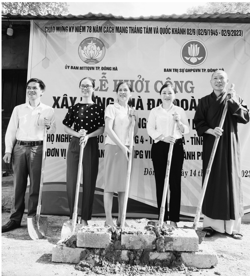
Lễ khởi công nhà Đại đoàn kết

Với sự sáng tạo và quyết tâm cao, việc tổ chức Ngày hội ở khu dân cư từng bước có sức lan tỏa trong đời sống của Nhân dân, được sự quan tâm, hỗ trợ của cấp ủy, chính quyền, Mặt trận, cả hệ thống chính trị đã vào cuộc, có trên 90% khu dân cư tổ chức Ngày hội có cả phần lễ và phần hội, thu hút thu hút hơn 250.000 lượt người tham gia. Tại Ngày hội đã ôn lại truyền thống MTTQVN qua các thời kỳ, sơ kết biểu dương, khen thưởng các tập thể, cá nhân tiêu biểu trong các phong trào, cuộc vận động; trao hàng nghìn suất quà động viên các hộ nghèo, hộ cận nghèo, hộ có hoàn cảnh đặc biệt khó khăn;