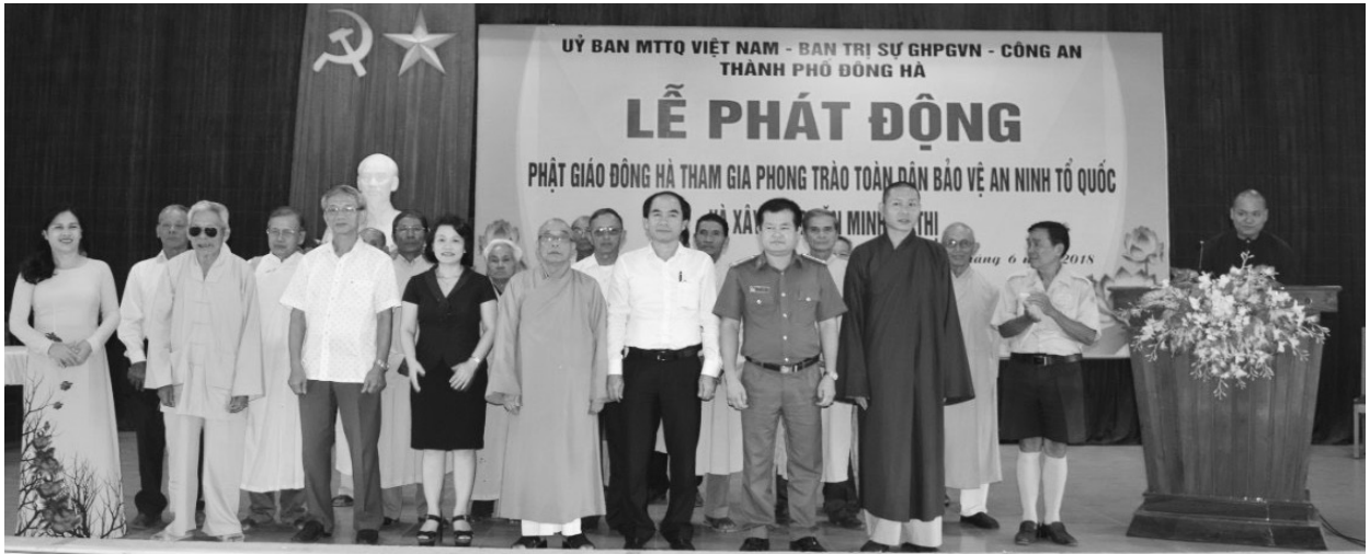
Lễ phát động Phật giáo Đông Hà tham gia phong trào toàn dân bảo vệ An ninh Tổ quốc và xây dựng văn minh đô thị

Các thế lực thù địch vẫn tiếp tục âm mưu “diễn biến hòa bình”, bạo loạn, lật đổ, nhằm xóa bỏ vai trò lãnh đạo của Đảng và chế độ XHCN ở nước ta; hoạt động của các loại tội phạm và tệ nạn xã hội có xu hướng gia tăng. Tình hình đó đặt ra cho lực lượng Công an nói chung, Công an thành phố Đông Hà nói riêng rất nhiều thách thức, đòi hỏi cần phải có những định hướng cụ thể, những nhiệm vụ trọng tâm sát đúng, phù hợp với tình hình thực tế của công tác đấu tranh phòng, chống tội phạm và xây dựng phong trào toàn dân bảo vệ ANTT tại địa bàn. Cụ thể: