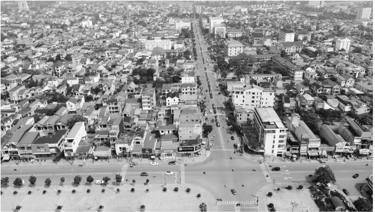
Một góc thành phố Đông Hà