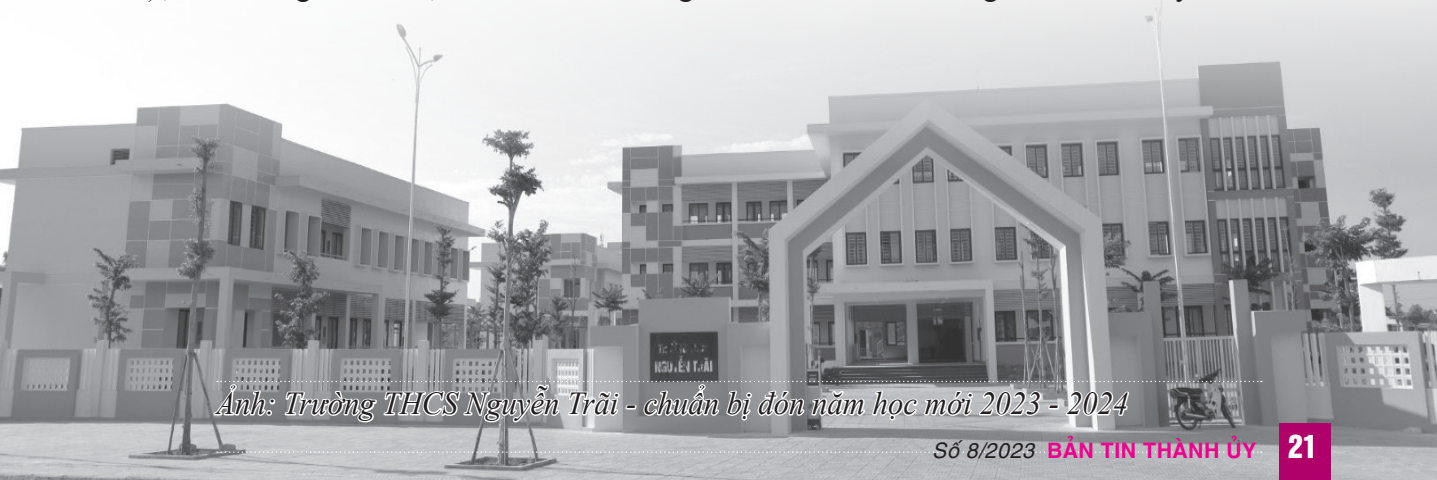
Ảnh: Trường THCS Nguyễn Trãi - chuẩn bị đón năm học mới 2023 - 2024

Thực hiện việc đảm bảo các chế độ, chính sách cho cán bộ, giáo viên nhân viên như: xét nâng lương định kỳ, nâng lương vượt khung, thâm niên nghề, thực hiện chế độ phụ cấp thâm niên lần đầu, giải quyết nghỉ hưu theo chế độ và nghỉ hưu trước tuổi. Công tác bồi dưỡng nâng cao trình độ lý luận chính