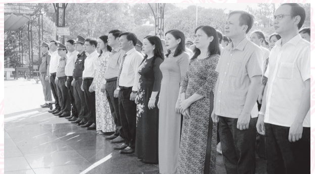
Đoàn đại biểu lãnh đạo thành phố đặt vòng hoa, kính viếng các Anh hùng liệt sĩ tại Nghĩa trang Liệt sĩ Quốc gia Đường 9

2. Chiều ngày 21/7/2023, Thành ủy, HĐND, UBND, UBMTTQVN thành phố Đông Hà đã đến đặt vòng hoa, dâng hương, kính viếng các Anh hùng liệt sĩ tại Nghĩa trang Liệt sĩ Quốc