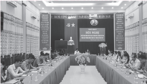
Hội nghị sơ kết hoạt động 6 tháng đầu năm 2023 của Ban Chỉ đạo 35 thành phố