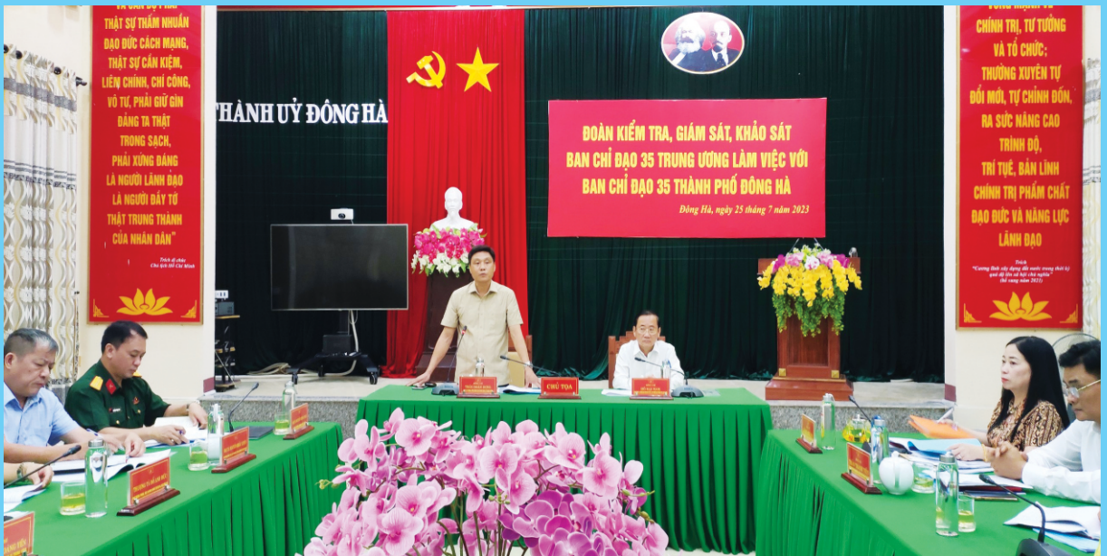
Đoàn kiểm tra, giám sát, khảo sát Ban chỉ đạo 35 Trung ương làm việc với Ban chỉ đạo 35 thành phố Đông Hà