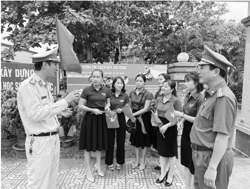
Công an thành phố tuyên truyền, vận động đoàn viên thanh niên tích cực tham gia phong trào toàn dân bảo vệ an ninh tổ quốc