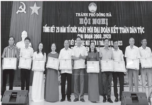
Ban Thường trực Ủy ban MTTQVN thành phố Đông Hà trao tặng cá nhân đã có thành tích xuất sắc trong 20 năm tổ chức Ngày hội Đại đoàn kết toàn dân tộc, giai đoạn 2003 - 2023

Hội nghị đã đánh giá những kết quả đạt được đồng thời rút ra những bài học kinh nghiệm của chặng đường 20 năm tổ chức Ngày hội Đại đoàn kết toàn dân tộc giai đoạn 2003 - 2023; kết quả công tác Mặt trận thành phố 6 tháng đầu năm 2023; tiến hành hiệp thương kiện toàn Ủy viên Ủy ban MTTQVN thành phố và Ủy viên Ban Thường trực Ủy ban MTTQ Việt Nam thành phố nhiệm kỳ 2019 - 2024.