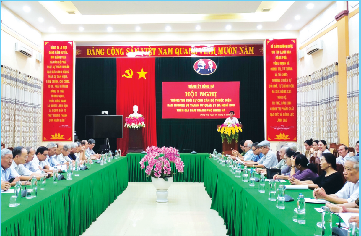
Hội nghị thông tin thời sự cho cán bộ thuộc diện Ban Thường vụ Thành ủy quản lý đã nghỉ hưu trên địa bàn thành phố Đông Hà