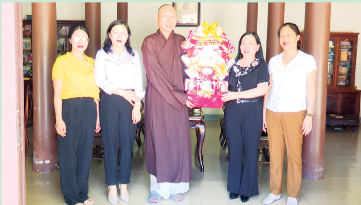
Đại diện lãnh đạo thành phố đến thăm và chúc mừng Ban trị sự Giáo hội Phật giáo Việt Nam thành phố nhân dịp lễ Vu Lan năm 2023