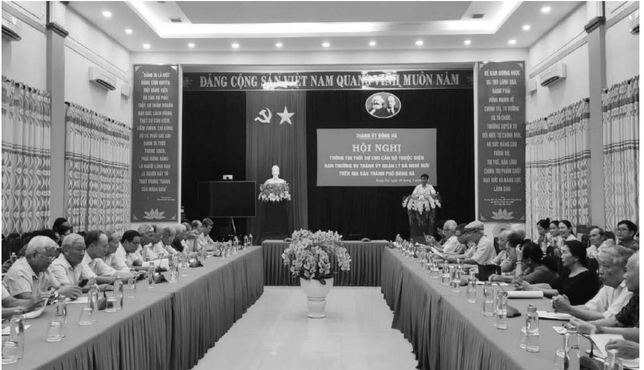
Hội nghị thông tin thời sự cho cán bộ thuộc diện Ban Thường vụ Thành ủy quản lý đã nghỉ hưu trên địa bàn thành phố Đông Hà

Tại các địa phương trong cả nước nói chung, tỉnh Quảng Trị và thành phố Đông Hà nói riêng, cán bộ hưu trí là đội ngũ đông đảo, có kinh nghiệm, bản lĩnh, uy tín đã và đang có những đóng góp quan trọng đối với sự phát triển của đất nước, địa phương, đóng góp xây dựng Đảng, xây dựng chính quyền trong sạch vững mạnh.