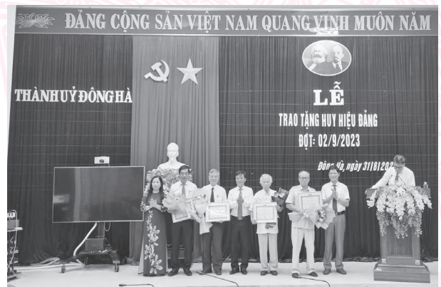
Thường trực Thành ủy trao tặng huy hiệu Đảng đợt 02/9/2023