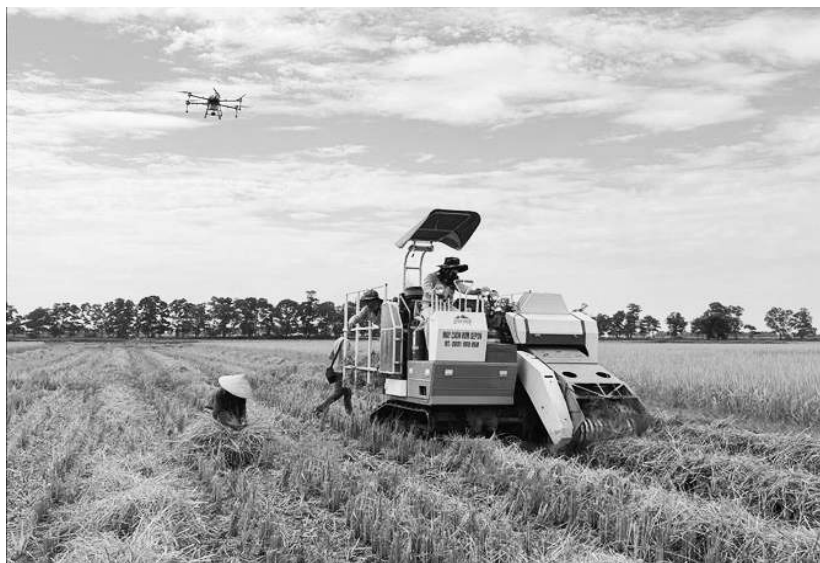
Thu hoạch lúa hữu cơ

Với những kết quả đạt được trong thực hiện “Phong trào nông dân thi đua sản xuất, kinh doanh giỏi, đoàn kết giúp nhau làm giàu và giảm nghèo bền vững” ở thành phố Đông Hà trong những năm qua đã tạo sự gắn bó giữa tổ chức Hội với hội viên nông dân, từ đó xây dựng tổ chức Hội ngày càng vững mạnh, góp phần quan trọng vào sự phát triển kinh tế - xã hội của thành phố.