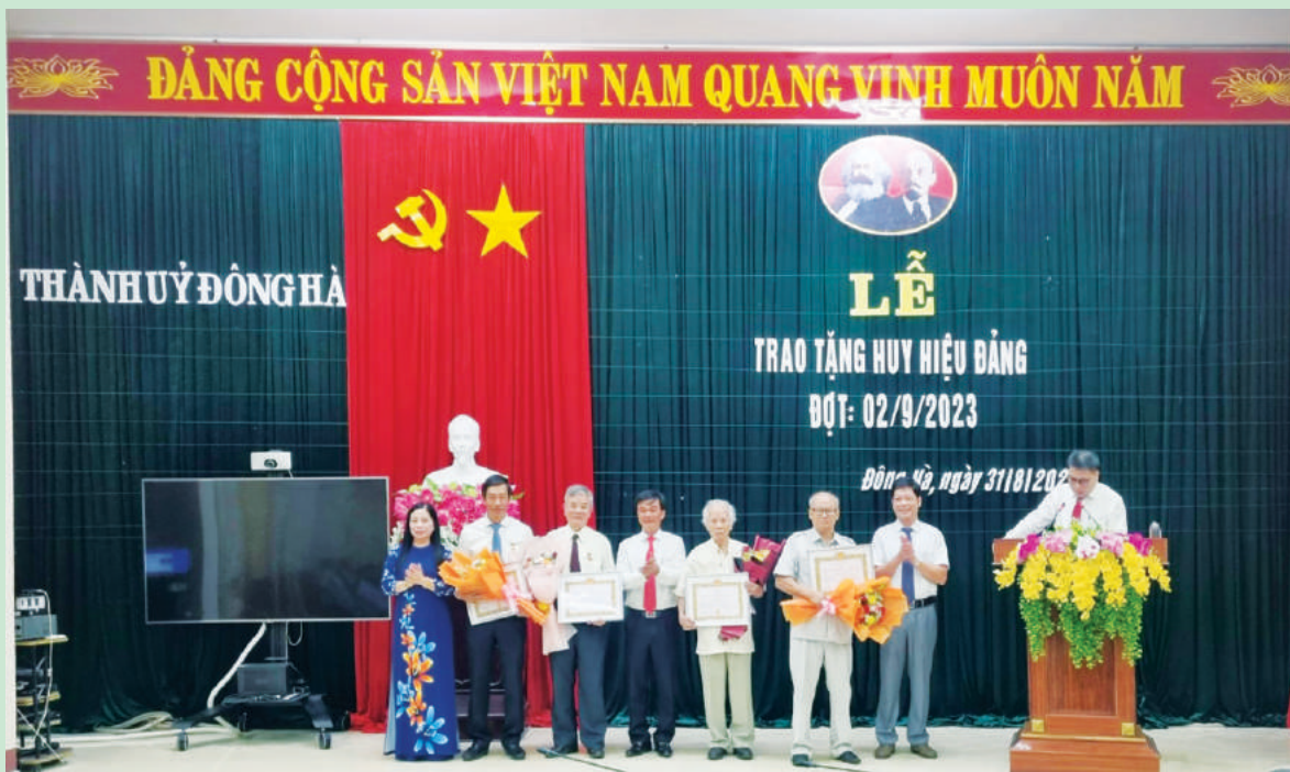
Thường trực Thành ủy trao Huy hiệu Đảng và tặng hoa cho các đảng viên nhận Huy hiệu Đảng đợt 02/9/2023