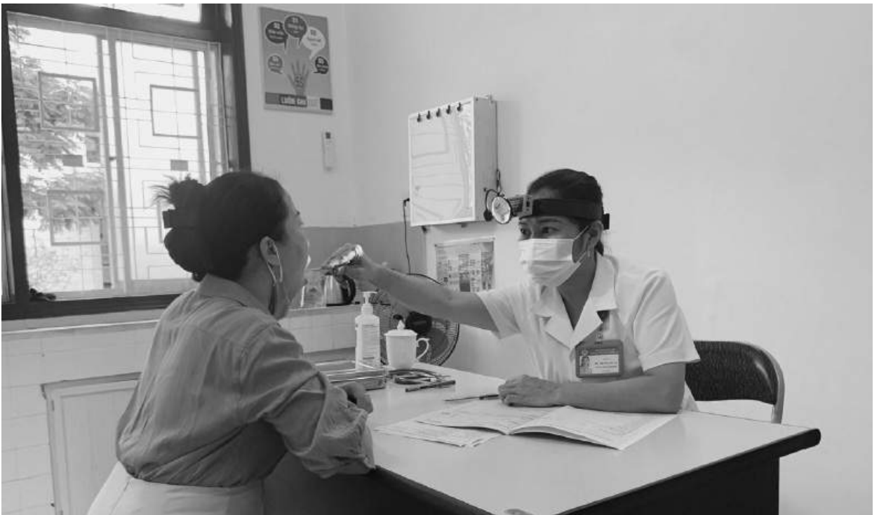
Khám sức khỏe định kỳ các trường có bếp ăn tập thể bán trú trên địa bàn TP Đông Hà

Đây là một hoạt động quan trọng nhằm phát hiện sớm các bệnh truyền nhiễm và các vấn đề về sức khỏe cho các đối tượng phục vụ ăn uống tại bếp ăn tập thể bán trú, nhằm chủ động phòng ngừa, chữa trị kịp thời, đảm bảo sức khỏe tốt nhất khi tham gia chế biến thực phẩm an toàn