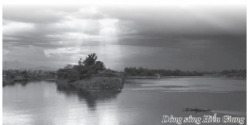
Dòng sông Hiếu Giang

Công tác đấu tranh phòng chống tội phạm được triển khai quyết liệt, tỷ lệ điều tra khám phá án năm sau cao hơn năm trước, trong đó các vụ án gây bức xúc trong Nhân dân nhanh chóng được điều tra khám phá đã tạo được lòng tin của quần chúng nhân