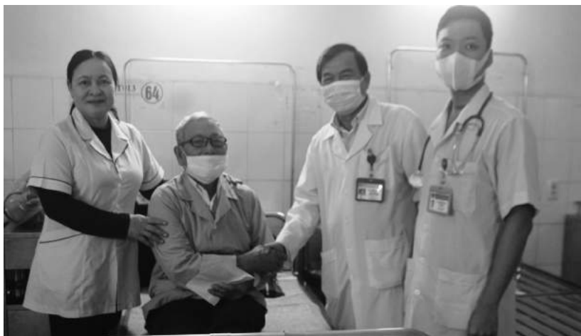
Thầy thuốc Trung tâm Y tế TP. Đông Hà thăm hỏi động viên người bệnh đang điều trị

Ngoài ra, Trung tâm Y tế thành phố tổ chức tập huấn về Thông tư số 13/2016/TTLT-BYT- BGDĐT ngày 12/5/2016 của liên Bộ Y tế và Bộ Giáo dục & Đào tạo về việc hướng dẫn thực hiện công tác y tế trường học; Quyết định số 3822/QĐ-BGDĐT, ngày 23/11/2020 của