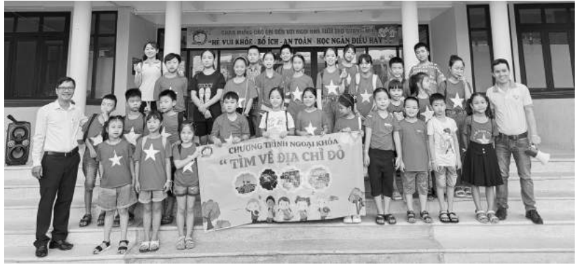
Nhà Thiếu nhi tỉnh Quảng Trị đã tổ chức chương trình dã ngoại “Tìm về địa chỉ ĐỎ”

Tham gia Hành trình, các em được tham quan tìm hiểu di tích lịch sử Thành cổ Quảng Trị là một Di tích quốc gia đặc biệt của Việt Nam tọa lạc ở trung tâm thị xã Quảng Trị, tỉnh Quảng Trị. Thành cổ Quảng Trị là công trình thành lũy quân sự và là lý sở của triều đình nhà Nguyễn trên địa hạt Quảng Trị. Đây cũng là trung tâm tinh lý Quảng Trị thời thuộc Pháp và chính quyền miền