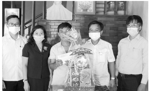
Lãnh đạo thành phố thăm, động viên gia đình chính sách tại Phường 3, thành phố Đông Hà

đối với người có công luôn được thực hiện đúng đủ, kịp thời. Trung bình hàng tháng tổ chức chi trả cho hơn 2.000 người có công với số tiền trợ cấp hơn 3,5 tỷ đồng. Ngoài ra, chi trả kịp thời, chính xác các chế độ trợ cấp một lần theo định kỳ hàng quý hàng năm bao gồm: chế độ ưu đãi giáo dục, trang cấp phương tiện trợ giúp và dụng cụ chỉnh hình, điều dưỡng tại chỗ, thờ cúng liệt sỹ hàng năm, và các chế độ chính sách theo quy định khác; mỗi năm chi trả gần 2200 lượt người, với số tiền 2,1 tỷ đồng. Bên cạnh đó, thường xuyên kiểm tra, rà soát, phối hợp chặt chẽ với đơn vị chi trả nhằm