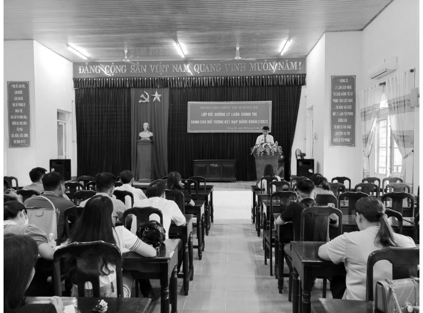
Lớp Bồi dưỡng LLCT dành cho đối tượng kết nạp Đảng khóa 2/2022

trí của lý luận, thời gian qua, dưới sự lãnh đạo, chỉ đạo của Ban Thường vụ, Thường trực Thành ủy, Trung tâm chính trị luôn coi trọng, chăm lo công tác giáo dục lý luận chính trị, góp phần củng cố sự đoàn kết, thống nhất trong Đảng; phòng, chống sự suy thoái về tư tưởng chính trị, đạo đức, lối sống, biểu hiện tự diễn biến, tự chuyển hóa trong nội bộ; nâng cao chất lượng đội ngũ cán bộ, đảng viên, đoàn viên, hội viên cơ sở đáp ứng yêu cầu nhiệm vụ trong tình hình mới.