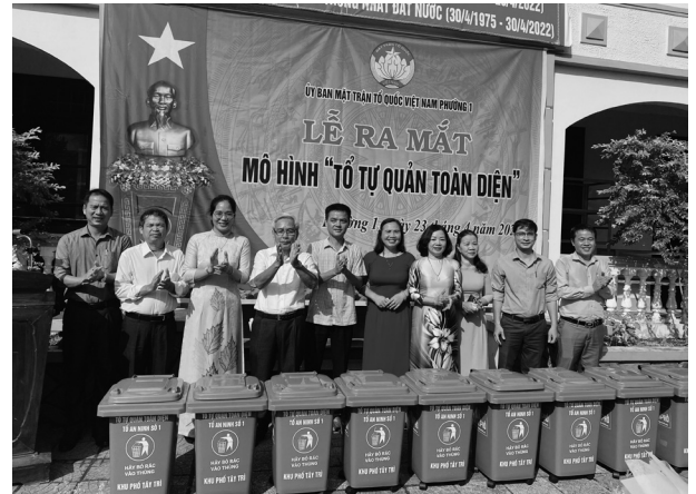
Ra mắt mô hình “tự quản toàn diện” tại Phường 1, thành phố Đông Hà

Với các nội dung sát tình hình thực tế địa phương, mô hình nhằm phát huy tính chủ động sáng tạo, ý thức, trách nhiệm mỗi người dân, mỗi gia đình trong xây dựng văn hóa, văn minh đô thị góp phần phát triển kinh tế - xã hội của địa phương. Hoạt động “ Tổ tự quản toàn diện ” trên tinh thần tự nguyện, tự giác, tự chịu trách nhiệm, các thành viên trong tổ hoạt động theo quy chế, quy định dưới sự hướng dẫn của UBMT phường, tập trung thực hiện theo 08 tiêu chí: (1) Các hộ dân trong các tổ An ninh không lấn chiếm vỉa hè, lòng lề đường làm nơi kinh doanh buôn bán; (2) Thường xuyên phối hợp phát động phong trào “ Thứ bảy tình nguyện, chủ nhật xanh ” tham gia vệ sinh môi trường, trồng cây, giữ gìn cảnh quan môi trường trong đoàn viên, hội viên và các tầng lớp Nhân dân; (3) Hướng dẫn các gia đình sử dụng tạm vỉa hè để tập kết vật liệu chuẩn bị xây nhà đến liên hệ UBND phường ký cam kết: Khi xây dựng nhà xong phải trả lại vỉa hè theo hiện trạng ban đầu, nếu chủ hộ không chấp hành đúng cam kết báo ngay với BCS khu phố để tham mưu với UBND phường kịp thời nhắc nhở xử lý; (4) khi tham gia giao thông phải chấp hành luật lệ giao thông, không gây rối và tụ tập gây rối trật tự công cộng, không để xảy ra bạo lực gia đình, trẻ em bỏ học, trẻ em hư vi