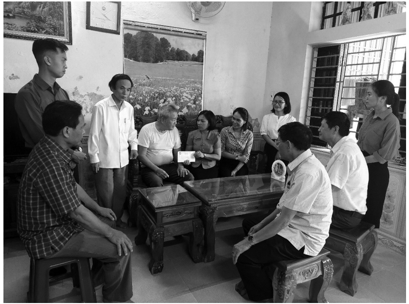
UBND, UBMTTQVN và các đoàn thể phường, Cấp ủy, Ban cán sự, Ban công tác Mặt trận khu phố 2 đến thăm tặng quà cho các gia đình chính sách, người có công.

Cùng với việc thăm hỏi, tặng quà; cán bộ, công