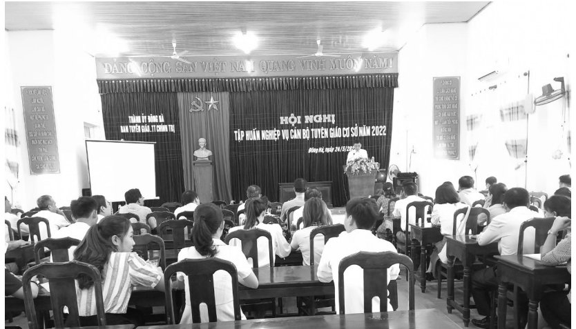
Hội nghị tập huấn nghiệp vụ cán bộ tuyên giáo cơ sở năm 2022

Sau Hội nghị thành lập Đảng, Ban Chấp hành Trung ương đã thành lập Ban Cố động và Tuyên truyền - cơ quan tham mưu, chỉ đạo công tác tư tưởng của Đảng với nhiệm vụ trước mắt là tuyên truyền, giác ngộ quần chúng về chủ nghĩa Mác - Lênin, về Chánh