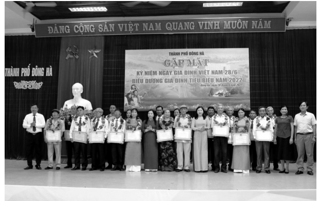
Lãnh đạo thành phố, Sở Thông tin và Truyền thông, Sở Văn hóa, Thể thao và Du lịch chúc mừng các gia đình văn hóa tiêu biểu xuất sắc năm 2022

2. Trong 03 ngày 21, 22 và 23/6/2022, đại biểu HĐND tỉnh và đại biểu HĐND thành phố đã tiếp xúc cử tri trước kỳ họp thường lệ giữa năm 2022 tại 05 phường: 1, 2, 4, 5 và Đông Giang. Tham dự hội nghị tiếp xúc cử tri có Tổ đại biểu HĐND tỉnh, Tổ đại biểu HĐND thành phố bầu trên địa bàn phường; đại diện các cơ quan, đơn vị các cấp thành phố cùng đông đảo cử tri trên địa bàn. Tại các hội nghị, cử tri các phường được nghe các báo cáo liên quan; đồng thời nêu một số tâm tư, nguyện vọng kiến nghị HĐND tỉnh, thành phố tập trung vào một số vấn đề việc về đầu tư hoàn thiện các công trình hạ tầng kỹ thuật, đảm bảo vệ sinh môi trường, thực hiện các chính sách xã hội, đảm bảo an ninh trật tự, ... Trên cơ sở các ý kiến, kiến nghị phản ánh, đại biểu các Tổ đại biểu HĐND tỉnh và thành phố đã nghiêm túc tiếp thu các ý kiến, kiến nghị của cử tri; đồng thời, giải đáp những ý kiến, kiến nghị có thể trả lời, làm rõ tại hội nghị.