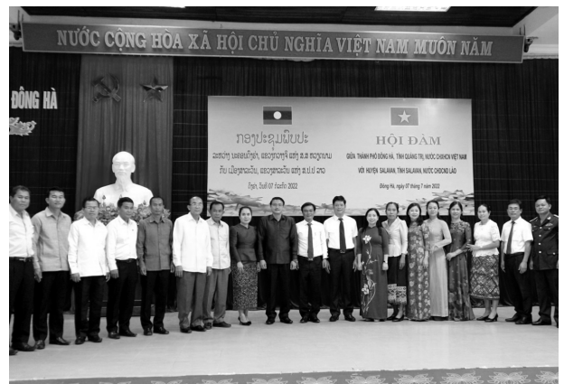
Lãnh đạo thành phố Đông Hà và đoàn công tác huyện Salavan chụp ảnh lưu niệm

ình, diễn biến trên các lĩnh vực để chỉ đạo, điều hành và chủ động xử lý, giải quyết theo thẩm quyền. Tập trung huy động có hiệu quả các nguồn vốn hỗ trợ của Trung ương, của tỉnh, các chương trình, dự án; triển khai dự án Phát triển đô thị ven biển miền Trung hướng đến tăng trưởng xanh và thích ứng biến đổi khí hậu, thành phố Đông Hà, tỉnh Quảng Trị từ nguồn vốn vay AFD. Tiếp tục hoàn chỉnh trình cấp có thẩm quyền phê duyệt Đề án phân loại đô thị thành phố Đông Hà đạt tiêu chuẩn đô thị loại II, Chương trình phát triển đô thị đến năm 2030. Triển khai các công trình trọng điểm, tuyến đường kết nối thành phố Đông Hà với Khu kinh tế trên địa bàn tỉnh Quảng Trị. Thực hiện các danh mục công trình theo Kế hoạch đầu tư công trung hạn giai đoạn 2021 - 2025. Tăng cường công tác quản lý thu, chi ngân sách; ưu tiên