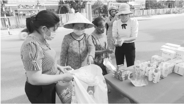
Chương trình đổi rác thải nhựa lấy quà tặng, góp phần bảo vệ môi trường của Hội LHPN phường Đông Thanh

Đây là hoạt động hưởng ứng ngày môi trường thế giới 5.6 do Hội Liên hiệp phụ nữ phường Đông Thanh, thành phố Đông Hà tổ chức vào ngày 4.6.2021, thu hút đông đảo chị em phụ nữ trên địa bàn phường tham gia.