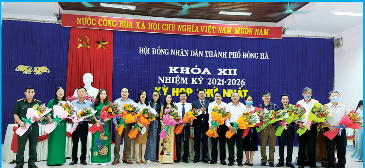
Một số hình ảnh tại kỳ họp thứ nhất HĐND thành phố khóa XII, nhiệm kỳ 2021 - 2026