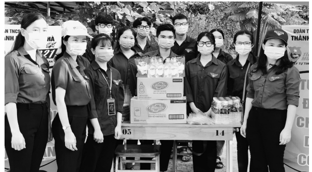
Thành đoàn Đông Hà tổ chức các đội hình thanh niên tình nguyện “Tiếp sức mùa thi” năm 2021

Tích cực tư vấn, hỗ trợ thí sinh về thông tin tuyển sinh, hướng dẫn phòng thi, phối hợp lực lượng chức năng xử lý các tình huống khẩn cấp đảm bảo an ninh trật tự tại các điểm thi, hỗ trợ điều tiết giao thông tại các giao lộ gần địa điểm thi và các nút giao thông trọng yếu, phát tặng các vật phẩm thiết yếu và hỗ trợ phụ huynh chấp hành nghiêm quy định giãn cách khi đưa đón con em tại các địa điểm thi. Hầu hết các thí sinh, người nhà đều có tâm trạng vui vẻ, hứng khởi và cảm động trước những hoạt động tình nguyện, góp phần tạo sự an tâm, tự tin cho các sĩ tử hoàn thành bài thi./.