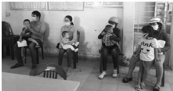
Thực hiện các biện pháp phòng, chống dịch bệnh COVID-19 trong triển khai chiến dịch uống Vitamin A, tẩy giun và cân đo trẻ

Nhằm đảm bảo công tác phòng chống dịch COVID-19 trong triển khai chiến dịch, các Trạm y tế đã thông báo cho các đối tượng đến uống thuốc và cân, đo theo các khung giờ khác nhau, phân luồng hợp lý để tránh tập trung đông người và giữ khoảng cách an toàn; người nhà đến Trạm Y tế đều đảm bảo quy trình đo thân nhiệt; trong khu vực chờ uống thuốc được vệ sinh sạch sẽ, thông thoáng, được bố trí sẵn khu vực rửa tay bằng xà phòng hoặc dung dịch sát khuẩn có cồn để nhân viên y tế, người dân đưa trẻ đến uống thuốc có thể sử dụng và bố trí phòng cách ly tạm thời. Trong quá trình thực hiện yêu cầu mọi người đeo khẩu trang, sát khuẩn tay, bảo đảm vệ sinh cá nhân, sắp xếp điểm uống theo nguyên tắc một chiều, có lối vào và ra và lưu ý người nhà mang theo cốc, thìa riêng của mỗi cháu để tránh lây nhiễm dịch bệnh.