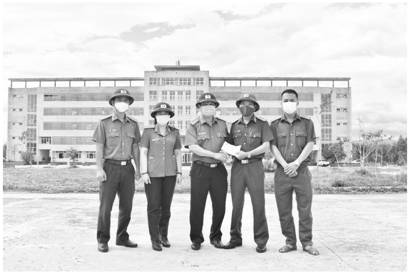
Lãnh đạo Công an thành phố thăm hỏi, động viên các lực lượng làm nhiệm vụ phòng chống dịch Covid 19

Đã chủ động nắm chắc và dự báo sát, đúng tình hình, tham mưu kịp thời, toàn diện cho cấp ủy Đảng, chính quyền trong xây dựng và ban hành nhiều chủ trương, giải pháp đảm bảo an ninh trật tự mang tính cấp bách và lâu dài đã tạo được sức mạnh tổng hợp của cả hệ thống chính trị, quần chúng Nhân dân trong phòng ngừa, tấn công, trấn áp tội phạm, giữ gìn trật tự an toàn xã hội. Những phức tạp liên quan trong tôn giáo, tranh chấp khiếu kiện trong nội bộ Nhân dân được tập trung giải quyết ngay từ cơ sở, không để phát sinh “điểm nóng”, đột xuất, bất ngờ.