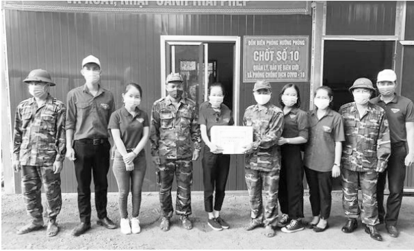
Thành đoàn Đông Hà thăm các chốt quản lý, bảo vệ biên giới phòng, chống Covid-19

chống Covid-19 của Đồn Biên phòng Hướng Phùng. Đoàn đã thăm và tặng quà cho Đồn Biên phòng Hướng Phùng và 05 chốt Biên phòng do Đồn quản lý với tổng trị giá 7.000.000 đồng.