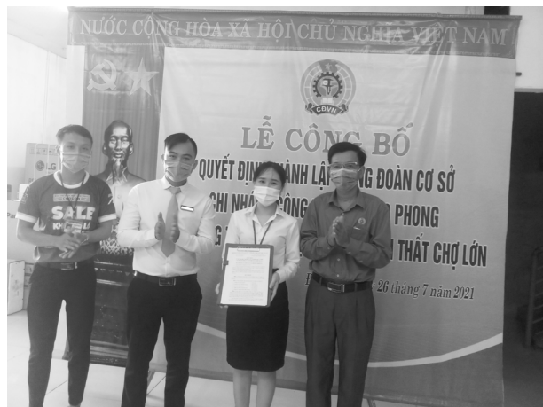
Lễ công bố quyết định thành lập công đoàn cơ sở đối với Chi nhánh công ty TNHH Cao Phong tại Quảng Trị - Siêu thị Điện máy nội thất Chợ Lớn

Ban Thường vụ LĐLĐ thành phố sẽ tiếp tục hướng dẫn, hỗ trợ CĐCS trong quá trình hoạt động, tổ chức tuyên truyền các chủ trương, chính sách liên quan đến quyền lợi người lao động, xây dựng, ký kết thoả ước lao động tập thể, đối thoại với người sử dụng lao động nhằm xây dựng quan hệ lao động hài hoà, ổn định, tiến bộ tại doanh nghiệp.