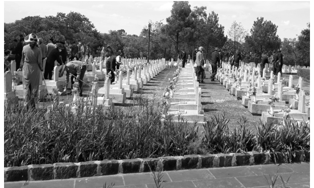
Liên ngành Hội CCB - ĐTN Phường 3, Phường 4 làm vệ sinh các khu mộ liệt sỹ tại Nghĩa trang liệt sỹ Quốc gia đường 9.

Nhân kỷ niệm 74 năm ngày Thương binh, Liệt sỹ (27/7/1947-27/7/2021), Ban Chỉ đạo liên ngành Hội Cựu chiến binh (CCB), Đoàn Thanh niên (ĐTN) thành phố triển khai Liên ngành Hội CCB, ĐTN Phường 3, Phường 4 phối hợp thắp nến tri ân các anh hùng liệt sỹ tại Nghĩa trang Quốc gia đường 9 do Tỉnh đoàn tổ chức. Liên ngành Hội CCB, ĐTN phường Đông Thanh tổ chức dâng hương, dâng hoa tại Di tích lịch sử (Cầu sắt xóm đò) phường Đông Thanh. Hội CCB phường Đông Giang, Đông Lương, Đông Thanh, Đông Lễ và Phường 2 tham gia lễ dâng hương, dâng hoa và thắp nến tri ân các anh hùng liệt sỹ tại nhà Bia ghi danh liệt sỹ do Đảng ủy, HĐND, UBND, UBMT phường tổ chức. Trước đó, đã tổ chức làm vệ sinh các khu mộ liệt sỹ tại Nghĩa trang liệt sỹ Quốc gia đường 9 và nhà Bia ghi danh liệt sỹ các Phường; đại diện Thường trực Hội CCB và Ban Chỉ huy quân sự thành phố đi thăm và trao sổ tiền an điều dưỡng tại gia đình cho 02 hội viên CCB, mỗi suất trị giá 2.200.000 đồng; Hội CCB, ĐTN phường Đông Giang tổ chức trồng hoa, cây cảnh, trị giá gần 05 triệu đồng tại nhà Bia ghi danh liệt sỹ của Phường; Hội CCB Phường 4 trao 05 bộ sách giáo khoa cấp 2 và 50 quyển vở, trị giá 1.000.000 đồng cho các cháu học sinh là con của các gia đình thuộc hộ nghèo, cận nghèo trên địa bàn Phường.