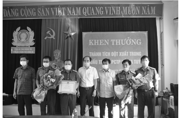
Lãnh đạo thành phố Đông Hà tặng hoa chúc mừng và thưởng nóng Công an thành phố về thành tích xuất sắc trong khám phá các chuyên án ma túy lớn

Song song với việc việc thu nhận hồ sơ truyền dữ liệu, tiếp nhận và trả CCCD cho người dân, CATP còn tập trung thực hiện có hiệu quả công tác phúc tra, kiểm tra thông tin, làm sạch dữ liệu dân cư; đảm bảo qua đó đến cuối tháng 4/2021, CATP đã thu nhận thông tin dân cư đối với 110.103/110.103 nhân khẩu trên địa