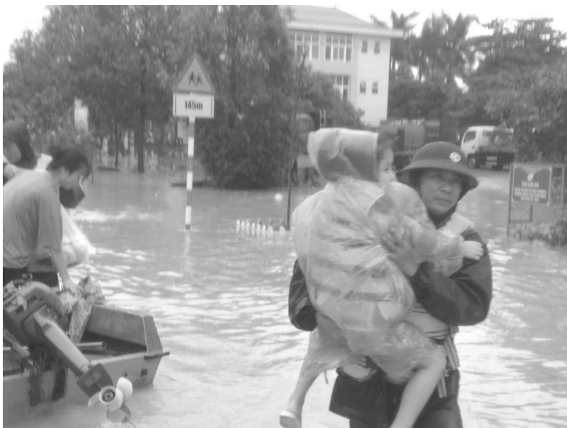
Cán bộ BCH Quân sự thành phố tham gia cứu hộ tài phưởng Đông Giang trong đợt lũ tháng 10/2020

Nêu gương là vấn đề thuộc về đạo đức. Đạo đức chỉ được thực hiện khi xuất phát từ lương tâm với sự tự giác, tự nguyện của mỗi người, nó khác với sự điều chỉnh