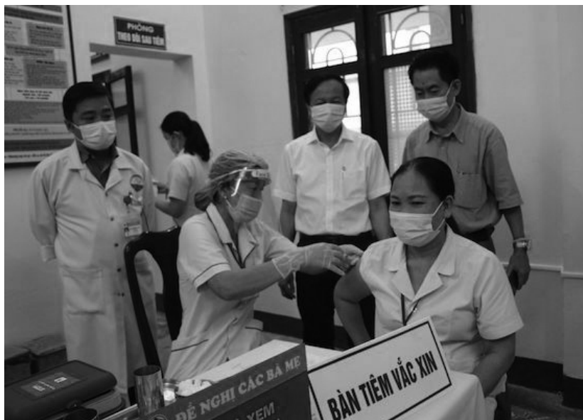
Công tác tiêm phòng Vắc xin Covid-19 tại Trung tâm y tế thành phố Đông Hà.

Thủ tướng chỉ đạo các nhiệm vụ, giải pháp trọng tâm