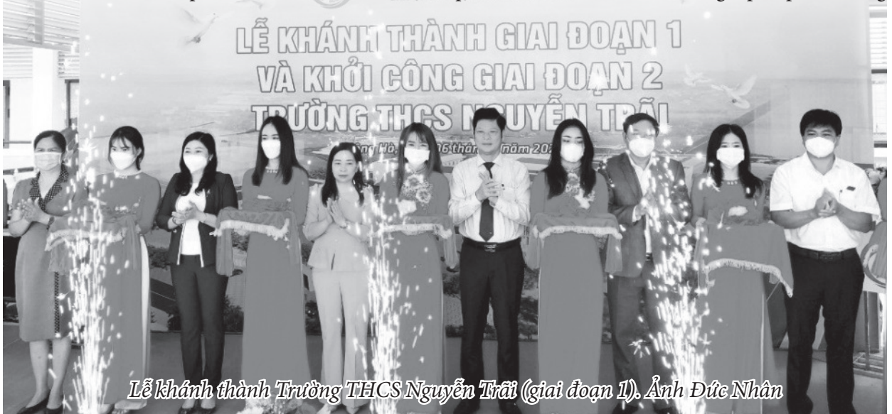
Lễ khánh thành Trường THCS Nguyễn Trãi (giai đoạn 1).

Mặt trận và các tổ chức chính trị-xã hội thành phố đã thực hiện tốt chức năng tập hợp, vận động