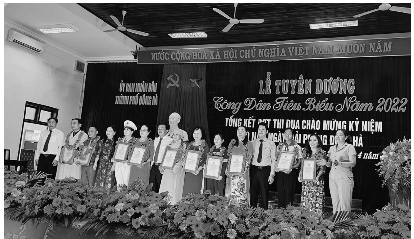
Lễ tuyên dương Công dân tiêu biểu năm 2022.

Tại các nơi đến thăm, chúc mừng, các đồng chí lãnh đạo thành phố ghi nhận sự đóng góp lớn lao của Ban Trị sự Giáo hội Phật giáo thành phố trong thời gian qua. Đoàn đã gửi tặng lễ vật và quà chúc mừng Ban trị sự Giáo hội Phật giáo thành phố nhân Đại lễ