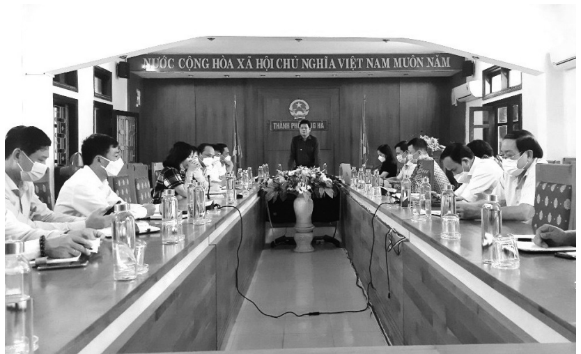
Đồng chí Hồ Sỹ Trung - PBT Thành ủy, CT UBND, Trưởng ban chỉ đạo thu ngân sách phát biểu tại phiên họp bàn công tác thu ngân sách năm 2022.

Nhìn chung các sắc thuế điều đã đạt khá cao và tăng so với cùng kỳ là nhờ tình hình dịch bệnh trên cả nước đang được kiểm soát, hoạt động sản