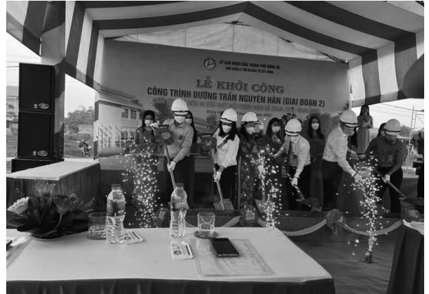
Lễ khởi công công trình đường Trần Nguyễn Hân (Giai đoạn 2).

góp phần tạo cảnh quan môi trường xanh, sạch, đẹp.