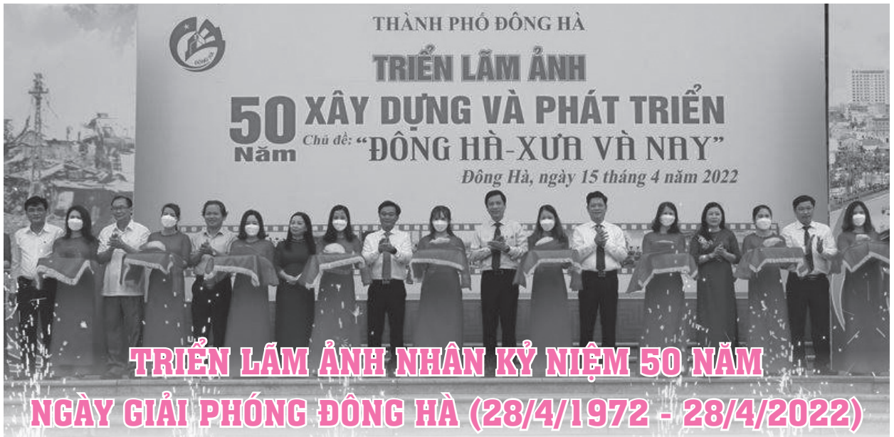
Tin bài, ảnh: Khánh Toàn

Nằm trong chuỗi sự kiện chào mừng kỷ niệm 50 năm giải phóng Quảng Trị. Chiều 15/4, tại Trung tâm Văn hoá - Điện ảnh tỉnh. Trung tâm Văn hoá thành phố Đông Hà tổ chức khai mạc Triển lãm ảnh với chủ đề: “Đông Hà - Xưa và nay” Chào mừng kỷ niệm 50 năm ngày giải phóng Đông Hà(28/4/1972 - 28/4/2022).