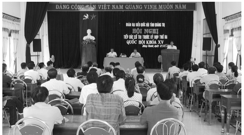
Hội nghị tiếp xúc cử tri trước Kỳ họp thứ Ba, Quốc hội khóa XV.

7. Sáng ngày 12/5/2022, Ban Tuyên giáo Trung ương tổ chức Hội nghị Báo cáo viên Trung ương tháng 5/2022 bằng hình thức trực tuyến. Dự hội nghị tại điểm cầu Thành ủy có các đồng chí Báo cáo viên, Cộng tác viên DLXH thành phố nhiệm kỳ 2020 - 2025; lãnh đạo, chuyên viên Ban Tuyên giáo, Trung tâm Chính trị thành phố. Trước khi vào Hội nghị chính thức, các đại biểu được nghe đồng chí Hồ Đại Nam - UVTV Tỉnh ủy, Trưởng Ban Tuyên giáo Tỉnh ủy thông tin về một số hoạt động kỷ niệm các ngày lễ lớn trong năm 2022 của tỉnh Quảng Trị. Tại Hội nghị, đồng chí Lại Xuân Môn - UV TW Đảng, Phó Trưởng Ban Tuyên giáo Trung ương thông báo nhanh kết quả Hội nghị lần thứ năm Ban Chấp hành Trung ương Đảng khóa XIII